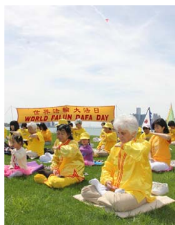
图（依序）：台湾大法弟子游行庆祝大法日；美国华盛顿 DC 法轮功小弟子们；美加边境的底特律河畔集体炼功