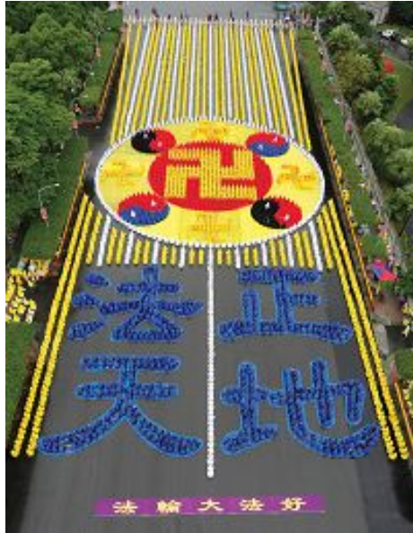
图：2012 年 11 月 17 日，五千名台湾法轮功学员在总统府前的广场上，排出“法正天地”及法轮功的标志法轮图形，场面宏伟壮观。

一个毕生追求宇宙人生的真理，遍览古今中外圣贤书籍而不得其解，困惑多多的人，忽然在一本书里发现了所有问题的答案，过去的一切矛盾疑团豁然开朗。