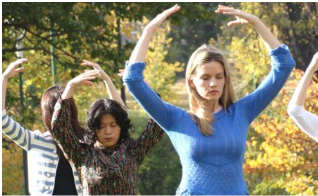
图：澳洲墨尔本法轮功学员五月十一日集体炼功