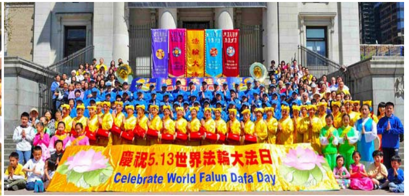
图：加拿大温哥华庆祝法轮大法弘传二十一周年