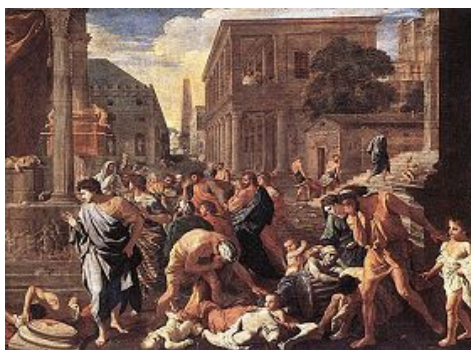
油画《阿什杜德的瘟疫》刻画了当时第四次大瘟疫可怕的情景。

法轮大法是佛法，真善忍是在教人向善。中共邪灵诽谤神佛，想彻底摧毁人类道德，是来毁灭人类的。中国人必须与中共划清界限，声明退出中共党团队。瘟疫确实是长着眼睛的。了解真相并付诸行动，才能避免古罗马人的悲剧在自身重演！