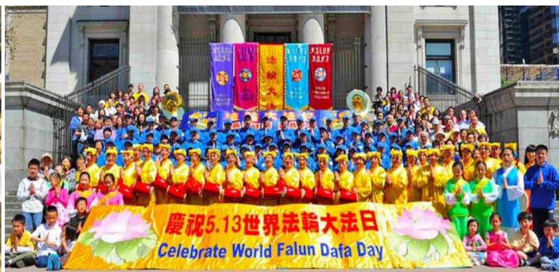
图：澳洲墨尔本法轮功学员五月十一日集体炼功