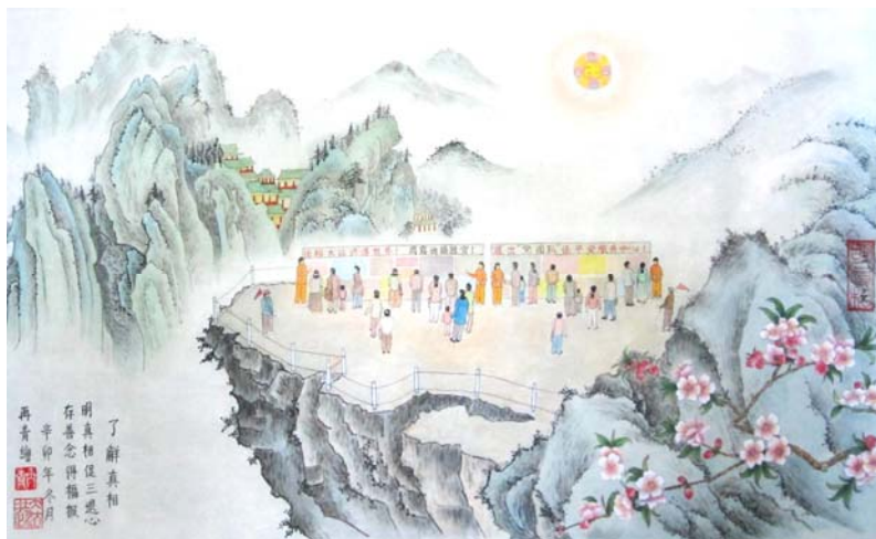
图：庆祝法轮大法日国画《了解真相》，作者：大陆大法弟子