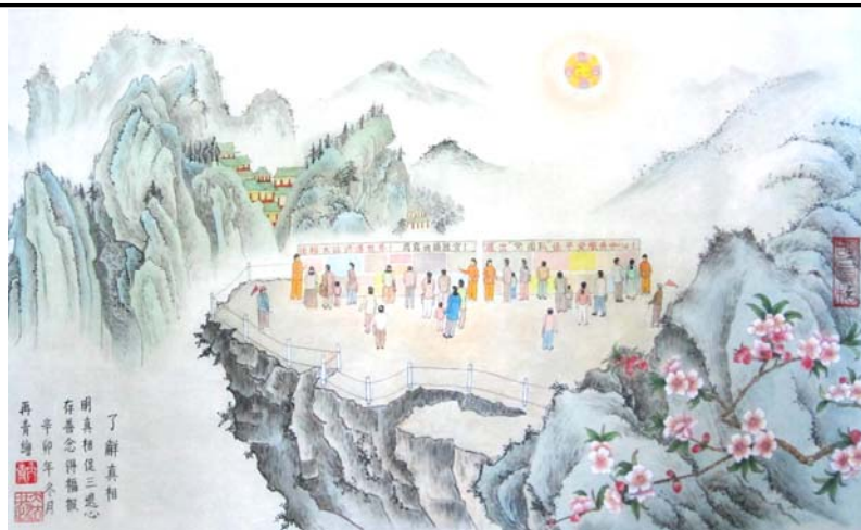
图：庆祝法轮大法日国画《了解真相》，作者：大陆大法弟子