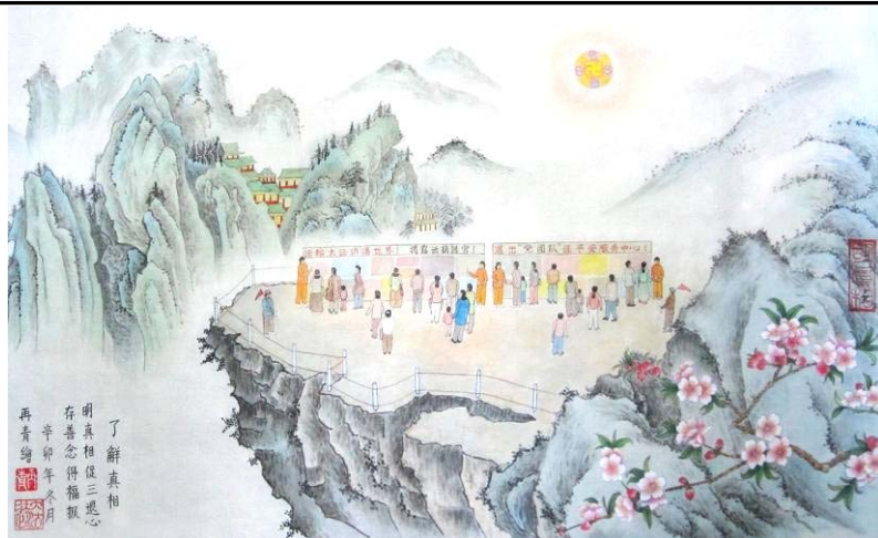
图：庆祝法轮大法日国画《了解真相》，作者：大陆大法弟子