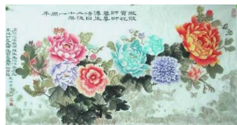
国画：敬贺师父传法 21 周年

这样的例子有很多，说也说不完。师尊佛恩浩荡，千言万语无法表达对师尊的感恩。（文／慧慧）◇