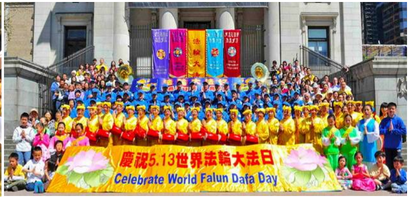
图：澳洲墨尔本法轮功学员五月十一日集体炼功