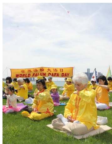
图（依序）：台湾大法弟子游行庆祝大法日；美国华盛顿 DC 法轮功小弟子们；美加边境的底特律河畔集体炼功