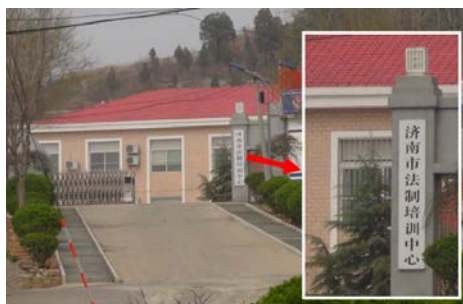
济南“六一零”洗脑班原在市中区刘长山, 现搬迁到仲宫镇大涧沟一道路旁的半山坡上, 图为大门口。