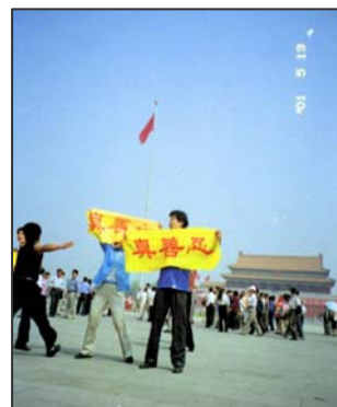
中国大陸法轮功学员面对中共警察的抓捕，在天安门广场打出“真善忍”横幅和平请愿。