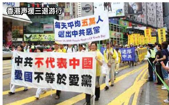
香港聲援三退遊行