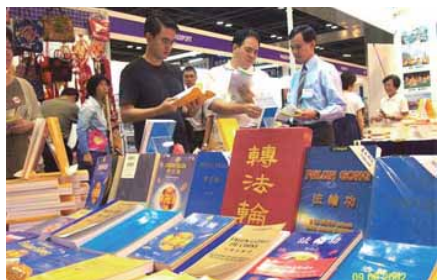
▲法轮功的书籍在2002年新加坡国际书展上展出