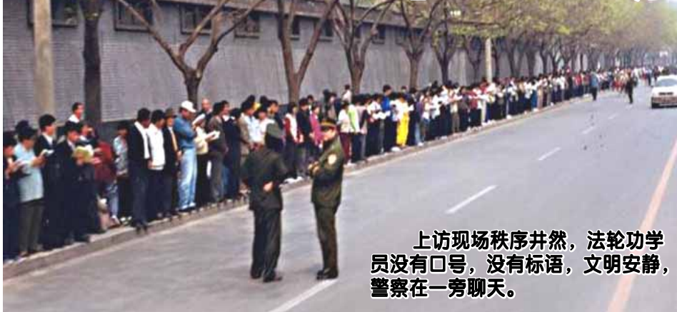
上访现场秩序井然，法轮功学员没有口号，没有标语，文明安静，警察在一旁聊天。