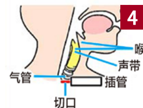
图4/气管切开手术要把插管伸到声道以下的喉咙里，以便病人可以呼吸。此时不能用嘴呼吸，气流进不到声带和喉部，所以不能说话。如果要说话，需要堵住这个插管，但声音是断断续续、漏气的，而且需要适应很长时间。

严重烧伤者要在无菌室接受治疗，严防感染，否则有生命危险。镜头中记者怎么能不穿防护服，还拿着满是细菌的话筒近距离采访“自焚者”呢？