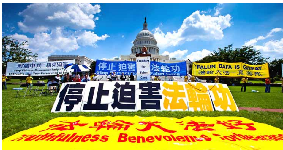
▲每年的7月多位美国政要都会参加在美国国会前举行的大型反迫害集会