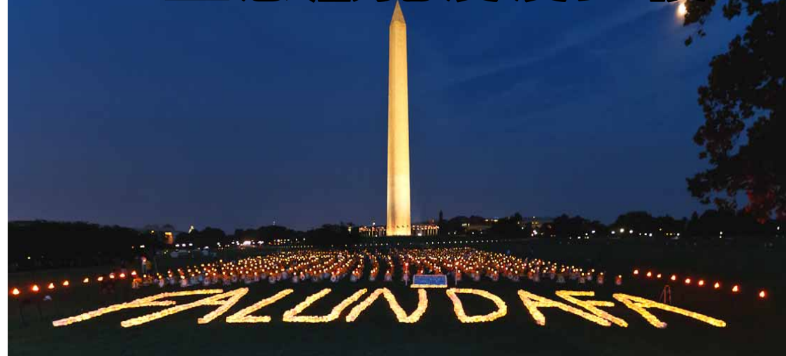
▲2010年7月22日晚，世界各地的一千多名法轮功学员来到美国首都华盛顿纪念碑前举行烛光悼念。

1999年7月20日迫害发生后，面对着中共群体灭绝式的迫害，法轮功学员们没有退缩。他们用和平对抗暴力，用理性揭露谎言，用生命捍卫真理，用坚忍不屈的精神铸就了中华民族的道德丰碑。