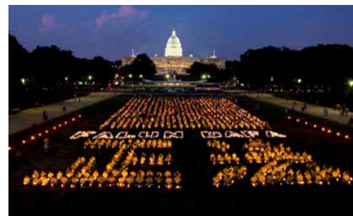
▲2008年7月华盛顿烛光悼念

每年7月，世界各地的法轮功学员都会举行烛光悼念活动，悼念那些为坚持“真善忍”信仰而献身的伟大生命。那点点烛光寄托着哀思，也象征着希望——正义一定会战胜邪恶，善念良知必将照亮漫漫长夜。