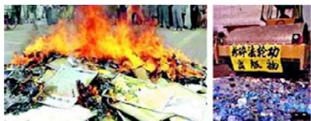
▲迫害伊始中共大量销毁法轮功书籍

法轮功的所有书籍和音像资料都可以从互联网上免费下载。然而中共为了制造一言堂的舆论，迫害一开始就大量销毁法轮功的书籍，并封锁互联网，让人们无法了解事实真相。