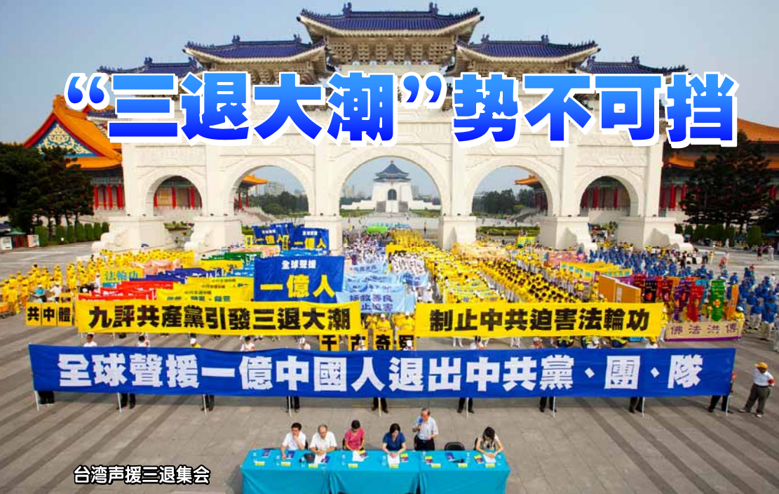
台灣聲援三退集會

2004年11月，揭露中共“假恶斗”本质的《九评共产党》一书横空出世，一直在大陆民间热传，并在海内外引起强烈震撼。