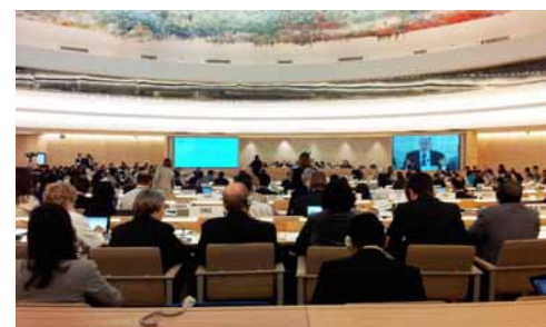
▲联合国第27届人权大会现场

《法新社》、德国《时代周刊》等多家国际媒体都做了相关报道，国际社会强烈谴责中共这一惊天罪行。美国国会众议院丹纳·罗拉巴克议员表示：活摘器官是“魔鬼的行径”，是严重的反人类罪行，我们必须尽最大努力把参与这种罪行的每个人都绳之以法。