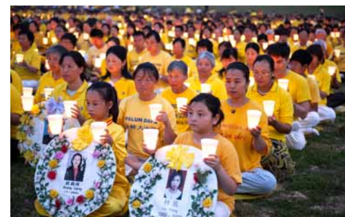
▲2012年7月华盛顿烛光悼念