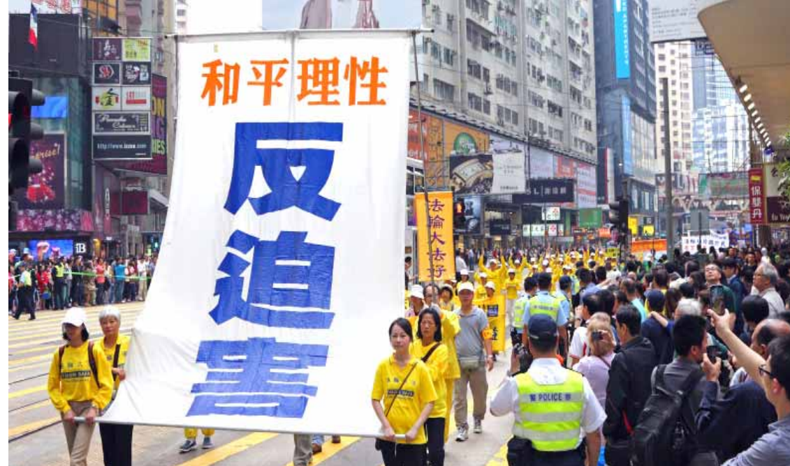
▲2013年4月香港法轮功学员纪念“四·二五”反迫害游行

每年世界各地举行的反迫害集会和大游行，展现了法轮功学员平和、善良的精神风貌，以及制止迫害的强大信心。声势浩大的游行队伍震撼人心，吸引路人驻足观看，很多人表示对反迫害的支持。