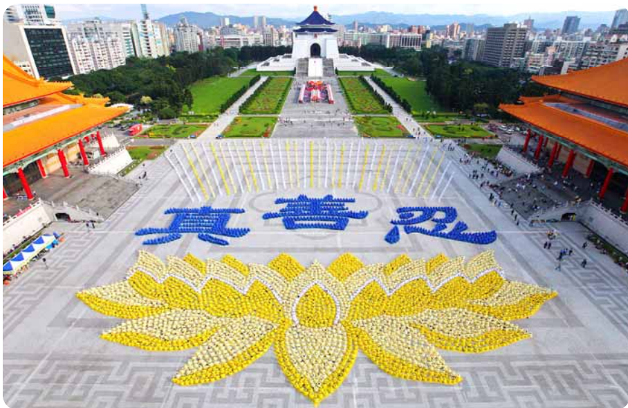
2010年11月27日五千多名法轮功学员于台北自由广场排字炼功