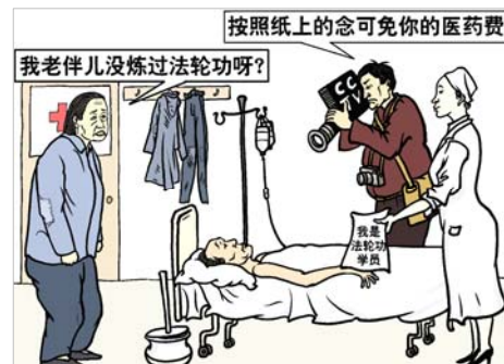
图：收买病人，利用病人的贪利、急切之心，制造伪证来陷害法轮功。

对此，法轮功学员一眼就能看出破绽：因为修炼法轮功是严禁喝酒的，可是中共摆拍的照片中却有酒具，那不明摆着是造假吗？然而中共封锁了所有的信息渠道后，人们无法了解法轮功真相。◇