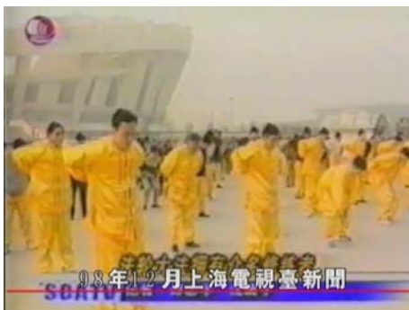
■ 视频截图：九八年上海万人晨炼

“今天一大早，上海体育中心人头攒动，本市近万名爱好法轮大法的炼功者会聚一处进行推广表演。法轮大法创始人李洪志师父于九二年向社会公开传功讲法，受到广大群众的欢迎……包括港、澳、台在内的全国各地都有自发