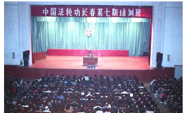
1994年4月长春第七期法轮功传授班