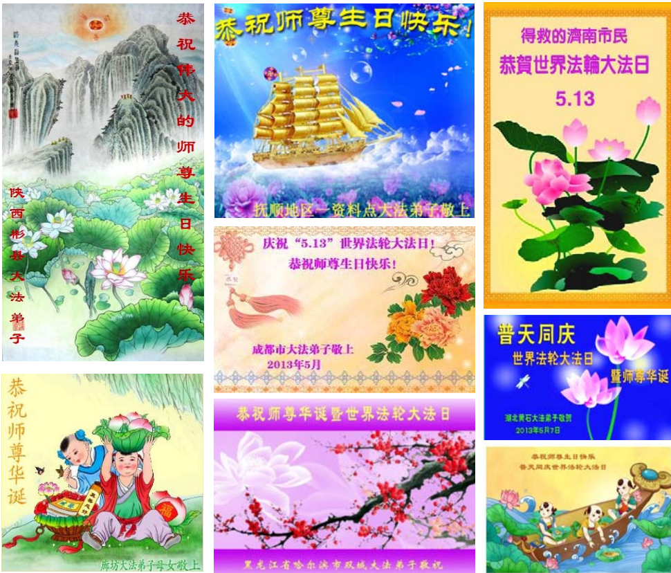
大陆各地法轮功学员、明真相世人向明慧网发来的贺卡精选

一位迫害过法轮功学员、后走入修炼的警察说：“我是一个迫害过大法弟子、罪业满身的罪人，能得到师尊的慈悲苦度，弟子用一切语言都无法表达对师尊的感恩之情，唯有在修炼的路上，严格以法为师，勇猛精进，让师尊少一分操