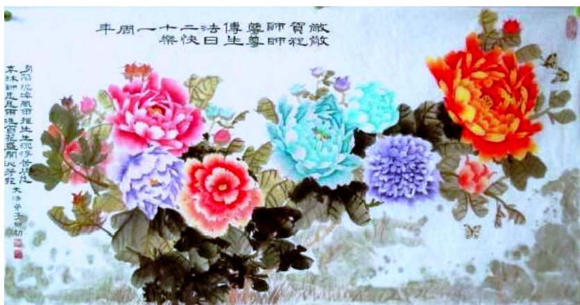
国画：《敬贺师父传法二十一年》 作者：大陆法轮功学员 配文：身陷泥淖风雨摧 生生沉浮苦与悲 幸沐师恩慈雨洗 百花盛开沁芳菲