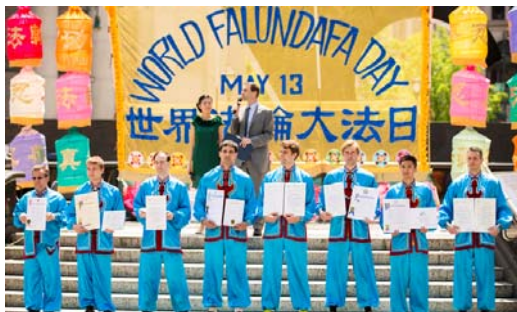
法轮功学员接受纽约州 13 位参议员联署对法轮大法的褒奖

因此，纽约州参议院通过慎重考虑，通过决议纪念“2013年5月13日，第14届世界法轮大法日”。◇