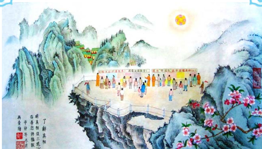
国画：《了解真相》 作者：大陆法轮功学员