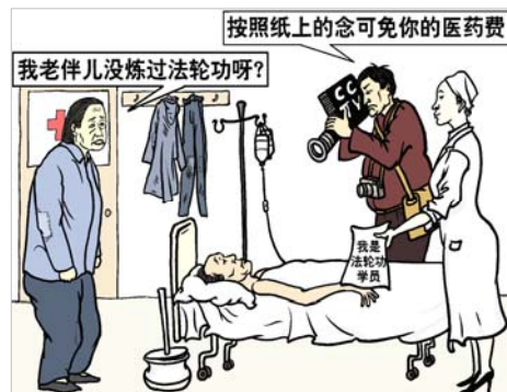
图：收买病人，利用病人的贪利、急切之心，制造伪证来陷害法轮功。

对此，法轮功学员一眼就能看出破绽：因为修炼法轮功是严禁喝酒的，可是中共摆拍的照片中却有酒具，那不明摆着是造假吗？然而中共封锁了所有的信息渠道后，人们无法了解法轮功真相。◇