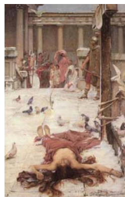
右图: 油画《梅里达的殉道士》, 12岁的圣·尤拉莉亚试图抗议地方长官强制祭祀的要求(以示服从罗马皇帝), 被处死。当年的基督徒难道是在“搞政治”吗?

被烧得七零八落, 可是他两腿之间却有个在大火中不燃烧、不变形的装汽油的塑料雪碧瓶。