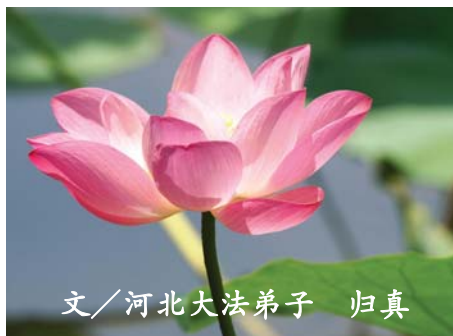
文/河北大法弟子 归真

我市各大医院全跑遍也没有查清病因，没办法只好前往北京。“301”、“307”、“中日友好”三个医院七个专家会诊，说我得的是“强直性脊柱炎”，又名“活癌症”，“大关节病”，就是所有能活动的各大关节都往死长。直着长死弯不倒，弯着长死伸不直，如果都长死，就是一个清清楚楚明明白白的植物人。可怕的是遗传，国际上也无能为力，没有任何