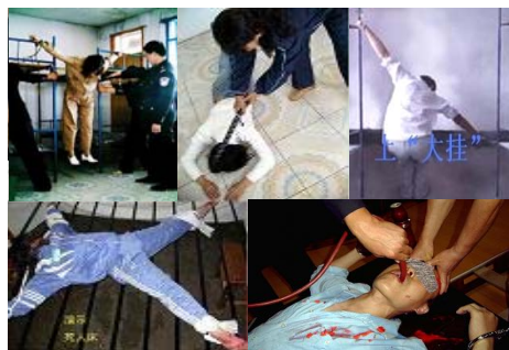
酷刑演示:吊铐、电棍电击、上大挂、死人床、野蛮灌食。

而读过《走出“马三家”》的朋友应该都了解,这篇报道中的酷刑的亲历者大多是无辜的上访百姓,文中根本没有提到法轮功学员。中共的“调查”结果,无异于此地无银三百两。那么,事实究竟是怎样的呢?