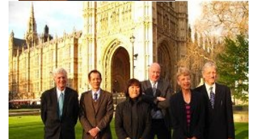
嘉宾在英国国会大厦前合影

身经历揭露中共政权如何迫害法轮功,如何大规模、系统性地屠杀、贩卖法轮功学员的器官牟利。