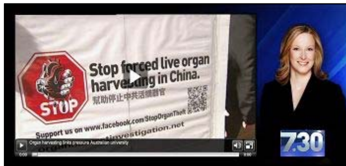
澳大利亚广播公司四月二十九日在其黄金时段播出了题为“活摘器官牵连令悉尼大学面临压力”的报导，在澳洲社会引起强烈反响。（网络截图）

加拿大前国会议员、《血腥的活摘器官》的另一名作者大卫·乔高在 BBC 的语音节目中举例说，二零零五年九月，黄洁夫去做肝脏移植的尝试试验，他不仅做了手术，还叫了另外两个备用肝脏。怎么叫的呢？他打了两个电话给两