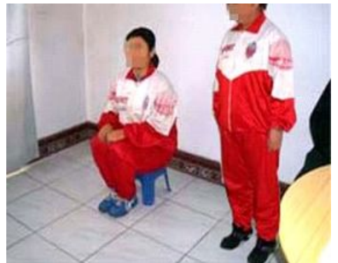
酷刑演示：长时间罚坐小凳子

狱中反迫害。集训期后，恶警为了“转化”她，把她又非法关押在十一监区加强迫害一年，被迫害得骨瘦如柴，违心“转化”后被非法关押在七监区，强迫参加超负荷的生产劳动。◇