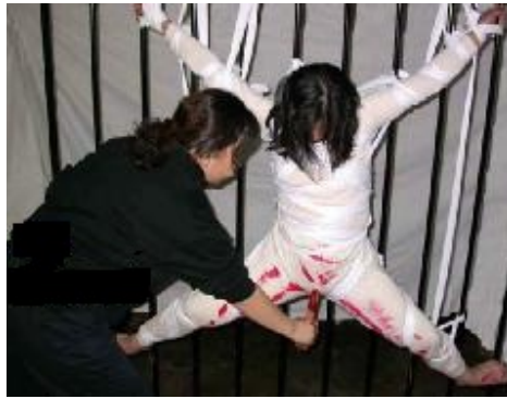
酷刑演示：用牙刷捅女学员下身

叫王丹的）用四把牙刷捆在一起刷法轮功女学员阴道，把女法轮功学员带到地下室迫害，扣在暖气管子上，法轮功学员只能半蹲，下面放一个水盆，只要往下坐就得坐水盆里，是冬天，地下室是没有门的。