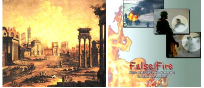
上图：公元 64 年 7 月，尼禄纵火罗马城，嫁祸基督徒。