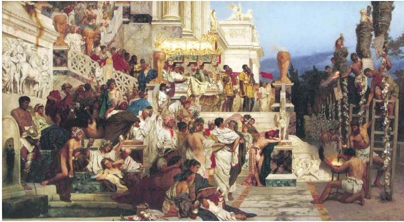
图：《尼禄的火炬》描绘罗马皇帝尼禄用火刑迫害基督徒的情景。右边基督徒被包裹着干草准备点燃；左边贵族、平民悠然地等待欣赏。