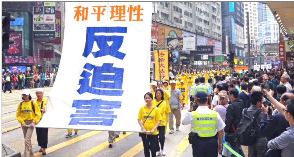
图：香港纪念“四·二五”反迫害游行，浩浩荡荡的法轮功队伍吸引民众拍照。