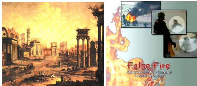
上图：公元 64 年 7 月，尼禄纵火罗马城，嫁祸基督徒。