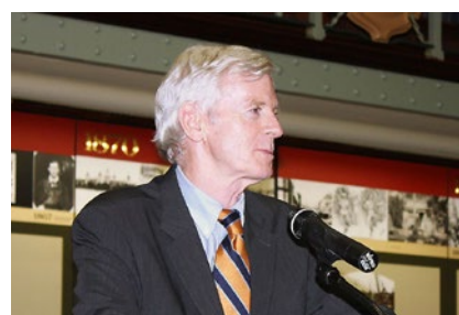
加拿大前亚太司司长大卫·乔高