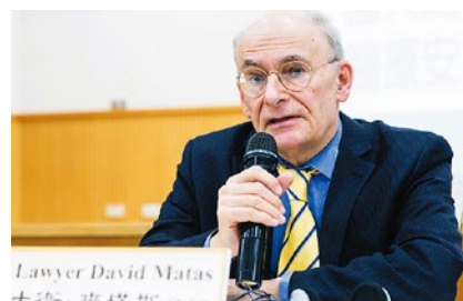
人权律师大卫·麦塔斯