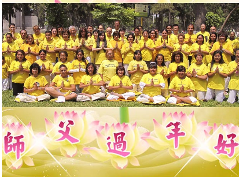
秘魯全體大法弟子癸巳新年合十叩拜

2013年正月初七，美国纽约法拉盛的人们，兴高采烈地以传统的游行庆祝癸巳小龙年的到来。在多姿多彩的游行队伍中，全球退党服务中心的队伍分外引人注目。