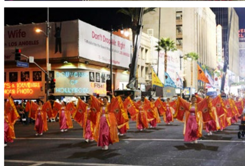
法轮功学员组成的仙女舞蹈队走在 好莱坞圣诞大游行的红地毯上