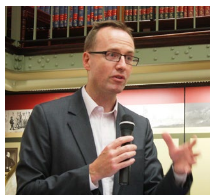
“中共直接参与活体摘取器官和贩卖”

澳洲司法事务发言人舒布瑞杰先生表示：多年来，在全球捐赠器官越来越少，只有在中国，人们可以在几个星期内就得到移植器官。他直指中共直接从被关押的人们，特别是从法轮功学员身上进行“活体摘取器官”的暴行，并在全球系统贩卖。