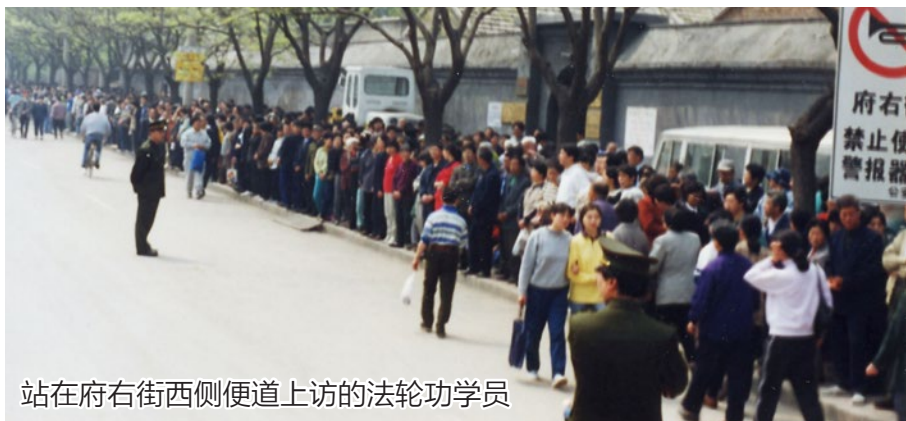
站在府右街西侧便道上访的法轮功学员

然而，江泽民却把和平上访污蔑为“围攻中南海”。十几年过去了，事实的真相究竟是怎么样的？让我们把镜头拉回到十几年前，看看 1999 年的那个 4 月到底发生了什么。