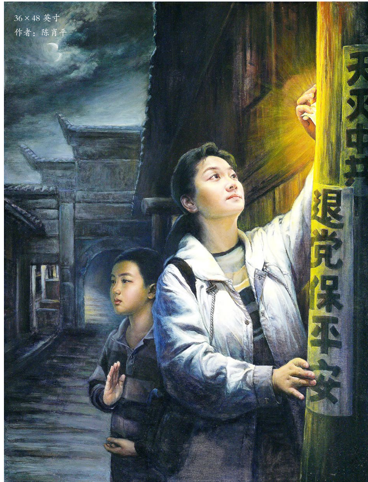
36 × 48 英寸 作者：陈肖平