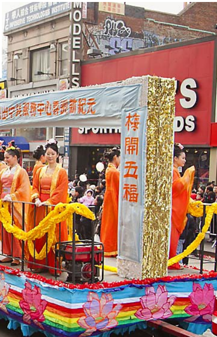
美国纽约新年大游行,法轮功学员制作的精美花车,受到观众热烈欢迎。