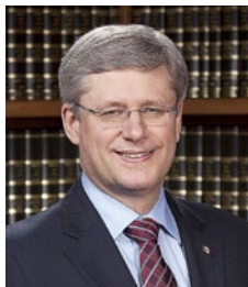
哈珀总理连续七年发出贺信

至今，五一三法轮大法日，已经不仅仅是法轮功学员庆祝并感恩的节日，也成为了很多国家政要和世人共同祝贺的日子。每年5月，加拿大总理及政府、省市政要都会给法轮大法学会发出贺信，他们称赞法轮大法修炼者长期弘扬“真、善、忍”理念，启迪世人，造福社会。