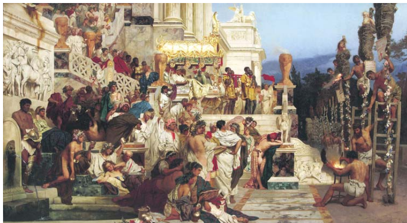
图：《尼禄的火炬》描绘罗马皇帝尼禄用火刑迫害基督徒的情景。右边基督徒被包裹着干草准备点燃；左边贵族、平民悠然地等待欣赏。