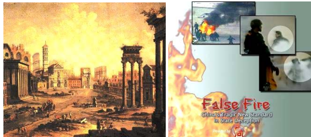
上图：公元 64 年 7 月，尼禄纵火罗马城，嫁祸基督徒。