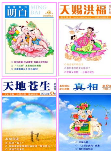
图: 部分明慧小册子(期刊)封面

老人回家后顾不上吃饭, 戴上眼镜先看了起来, 立刻被书中的内容吸引住了, 越看越觉得真相资料说的太好了, 太对了。越看身体越觉得轻松, 越精神。其中有两个字不识, 又查看了字典。看完真相材料, 老人准备去