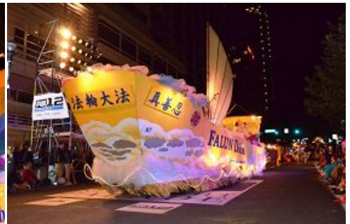
图: 游行中法轮功学员的花车

夜幕徐徐降临, 在满天璀璨繁星和各花车熠熠灯光的闪耀下, 游行活动拉开序幕。伴随着热闹的鼓声和各花车队伍的行进, 炫目的灯光下, 法轮功队伍的“法船”花车在优美祥和