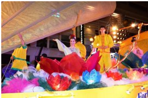
图: 法轮功学员参加“玫瑰节星光游行”

服饰所吸引, 其他游行队伍的参与者也对此赞叹不已, 纷纷给“法船”拍照。有些人迫不及待上前询问, “法船”何时启航。