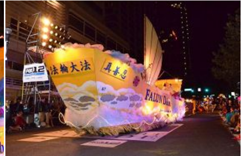
图: 游行中法轮功学员的花车

夜幕徐徐降临, 在满天璀璨繁星和各花车熠熠灯光的闪耀下, 游行活动拉开序幕。伴随着热闹的鼓号声和各花车队伍的行进, 炫目的灯光下, 法轮功队伍的“法船”花车在优美祥和