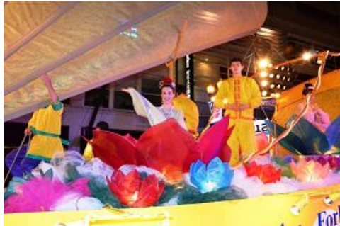
图: 法轮功学员参加“玫瑰节星光游行”

服饰所吸引, 其他游行队伍的参与者也对此赞叹不已, 纷纷给“法船”拍照。有些人迫不及待上前询问, “法船”何时启航。