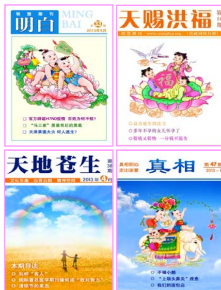
图: 部分明慧小册子(期刊)封面

老人回家后顾不上吃饭, 戴上眼镜先看了起来, 立刻被书中的内容吸引住了, 越看越觉得真相资料说的太好了, 太对了。越看身体越觉得轻松, 越精神。其中有两个字不识, 又查看了字典。看完真相材料, 老人准备去吃饭时, 感觉怎么裤子好像肥了, 鞋