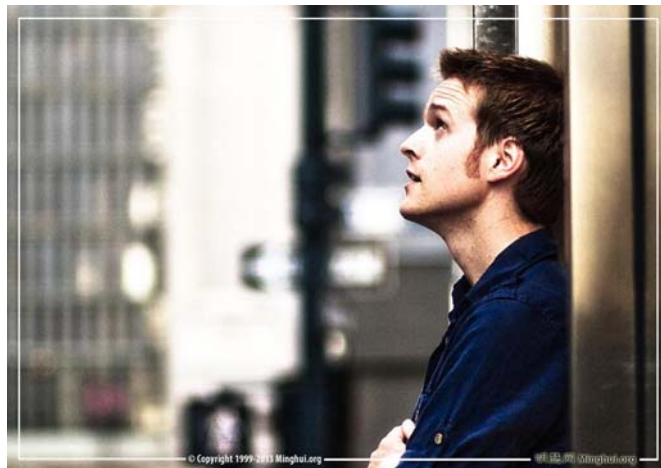
图：通俗歌手、词曲作家德鲁·帕克

以前读过很多书，其中也不乏教人做好人的，但看归看，做归做，在矛盾面前，我还是无法做到。而大法最奇妙之处，在于他有改变人心的巨大力量。”