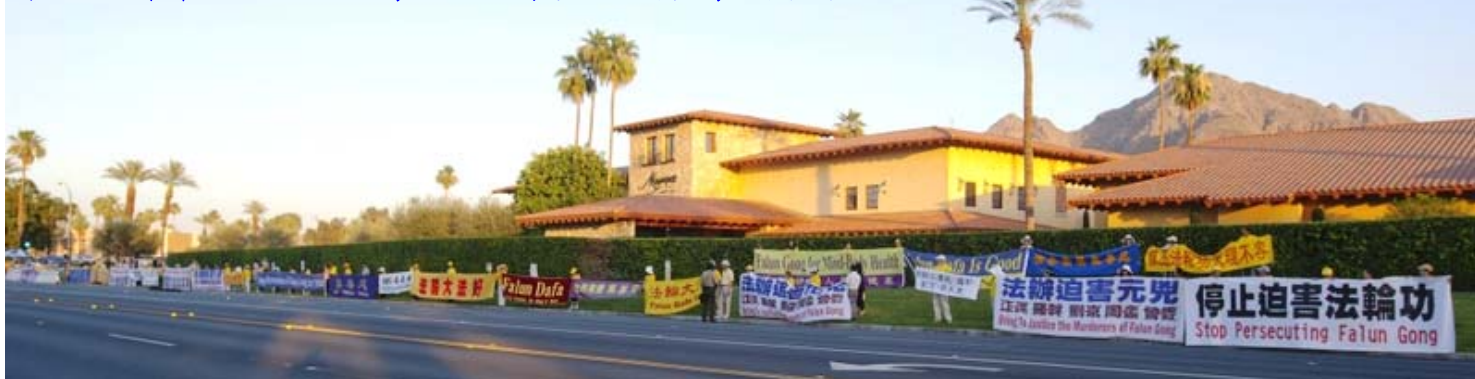
图: 习近平车队必经之路上, 法轮功学员打起横幅, 要求将迫害元凶绳之以法