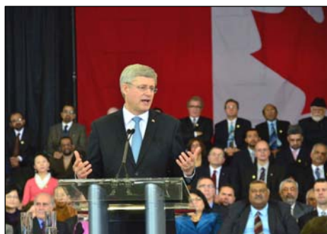
图：哈珀宣布成立宗教自由办公室

二零一三年二月十九日，加拿大总理哈珀宣布在外交部成立宗教自由办公室，并表示法轮功信仰团体遭受的迫害是加拿大政府的关注之一。◇