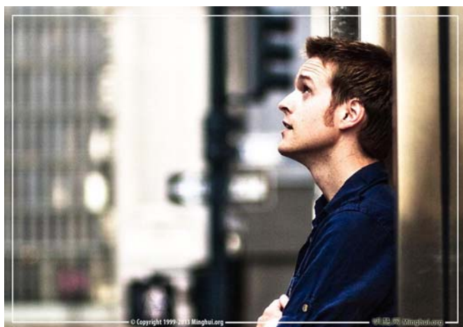
图：通俗歌手、词曲作家德鲁·帕克

以前读过很多书，其中也不乏教人做好人的，但看归看，做归做，在矛盾面前，我还是无法做到。而大法最奇妙之处，在于他有改变人心的巨大力量。”