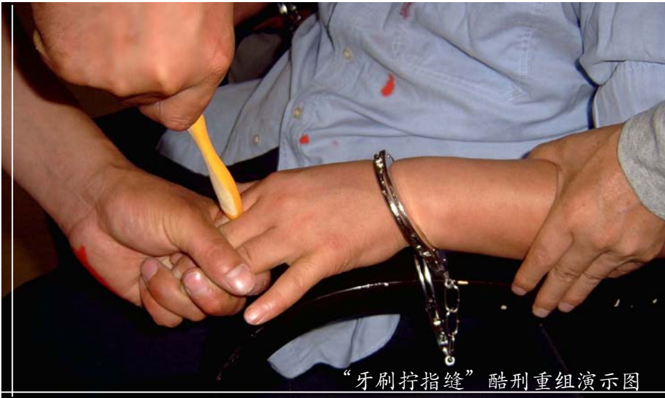
“牙刷拧指缝”酷刑重组演示图