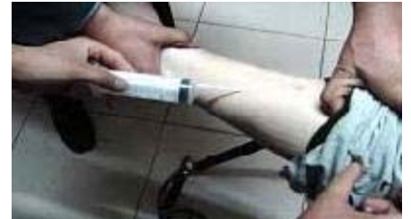
中共酷刑演示：注射不明药物

注射等迫害手段。长期以来，监狱的奴役劳动时间是十五、六小时，特别是节假日到来之际，监狱给多个厂家加工节日用品，生产包装假药等，每天高强度劳动达二十个小时以上。◇