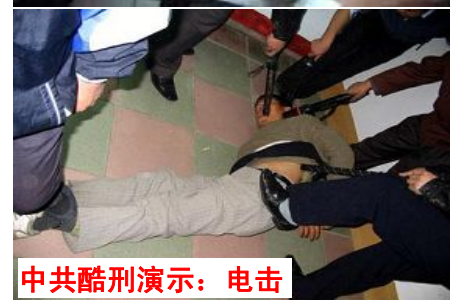
中共酷刑演示：电击