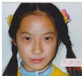
左：摄于1999年2月，长达四年的皮炎还相当严重。 上图：摄于1999年6月，皮肤奇迹般正常了。

二零一二年世界卫生组织在一项研讨会上警告，滥用抗生素已使得细菌的抗药性快速增加，一般的手术或轻微的感染都可能置人于死地，相当于现代医学的终结。今天，将我女儿的经历与您分享，也为您献上一份真诚的祝福。