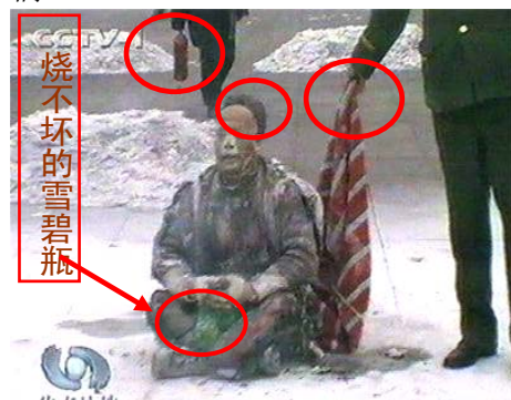
天安门自焚疑点之一

我非常感慨:真是“一人得法是全家人受益。”明白法轮大法真相的人 would 得福报的!千真万确!在此代表全家和众生感谢师父的救命之恩!叩拜师父!(明慧网江西供稿)