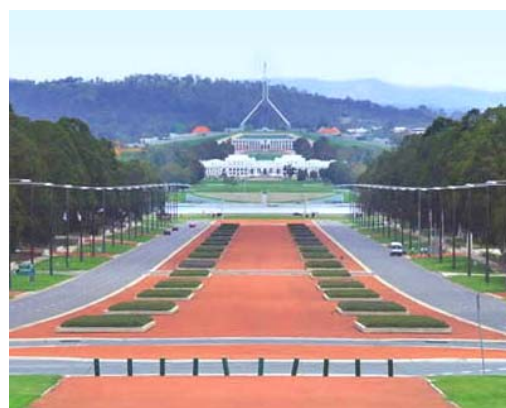
国会大厦与澳洲自然环境相融

国会大厦坐落在一个小丘之上，面对山岗，居高临下，气势非凡。国会大厦占地 32 公顷，地上建筑有 6 层，底层为停车场，屋顶上矗立着一根高 81 米、重 220 吨的不锈钢旗杆，成为堪培拉的标志性建筑。