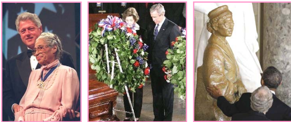
左图：1996年9月14日美国总统克林顿授予罗莎·帕克斯“总统自由奖章”

罗莎被美国民众尊称为“民权运动之母”，因为她为自己和黑人争取权利的同时，唤醒了更广大民众的良知，让全美民众认识了社会中的不公及不义，进而维护了整个社会的公正与道义，让更多的人受惠其中。正是当年罗莎的所谓“违法”行为，改变了美国的历史。◇