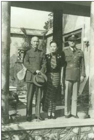
1945年3月蒋中正、宋美龄在昆明与来华支援抗日战争的美国空军飞虎队队长陈纳德合影。可见“反共者”并不“反华”。

说有人反共，那是很普通的事。可是，中共在批判反共言论时，总是给对方贴上“反华”的标签，“反华势力亡我之心不死”。如果是中国人反对中共，更被骂作“卖国”、“给中国人民抹黑”等等，潜移默化地灌输“中共”就是“中国”，就是“中国人民”。