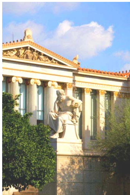
雅典学院的苏格拉底雕像

“认识你自己”——这句镌刻在特尔斐神庙上的名言，曾赋予了苏格拉底一种深沉智慧的目光。而今，苏格拉底的证明则向我们开启了一扇智慧之门：许多时候，认识自己，或者认识真理，都是从认识自己的无知开始的。（文/无名）◇