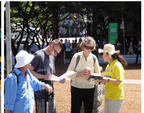
图 1: 温哥华市中心艺术馆前的集会现场