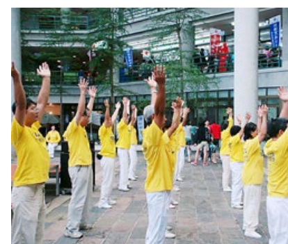
法轮功学员在中正大学学生活动中心演示功法。