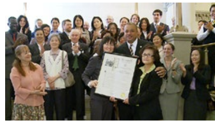
2011年，纽约州众议会宣布5月份为纽约州法轮大法月。

纽约州众议员艾里克·史蒂文森与法轮功学员握手并合影留念。他说：“正义总是会战胜邪恶。我很遗憾迫害还在进行，针对（法轮功）这样和平的活动。我希望迫害能尽早结束。我希望那些人能理解并允许这些人过和平的生活，尊重（法轮功）这项活动。”