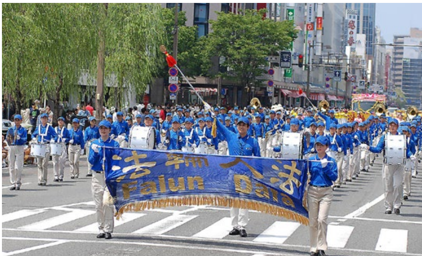
由日本法轮功学员组成的天国乐团参加“新泻节”大游行。