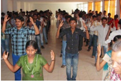
JB 工程学院的学生在炼功。