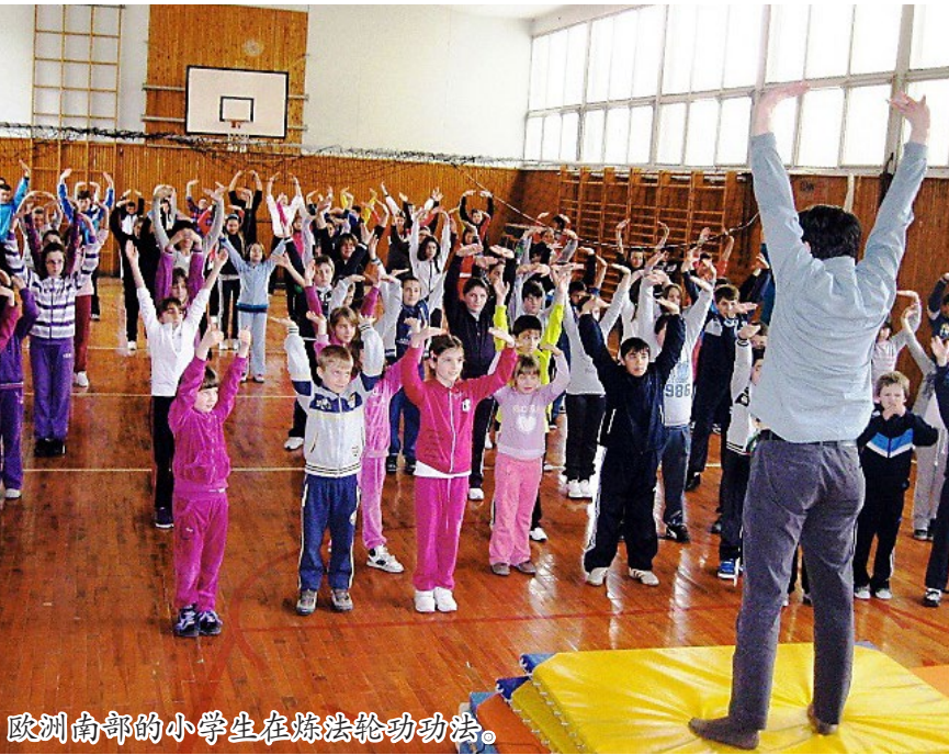
欧洲南部的小学生在炼法轮功功法。