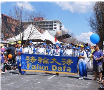
由澳洲法轮功学员组成的天国乐团参加图文巴市花节大游行。