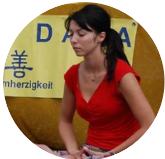
奥地利女雕塑家 修炼法轮功 思维被打开

关贵敏曾是国家一级演员，获得第13届世界青年艺术节最高艺术成就奖。后被疾病折磨得几乎停止了艺术生涯。1996年，关贵敏修炼了法轮功，疾病不药而愈。现在，关贵敏是神韵艺术团歌唱演员，像年轻人一样精力充沛，他说：“这一切福份都源于修炼大法。”