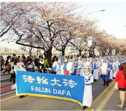
韩国法轮功学员组成的天国乐团受到了市民们的热烈欢迎。