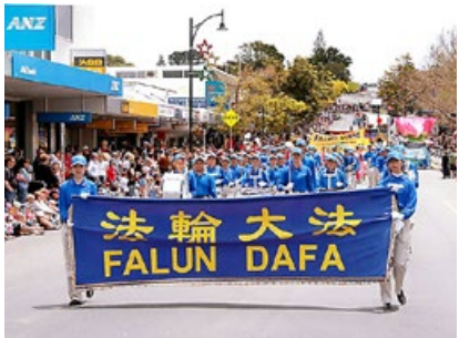
圣诞游行，新西兰法轮功学员组成的天国乐团靓丽登场。