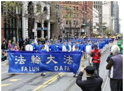
天国乐团参加美国旧金山圣派翠克日大游行。