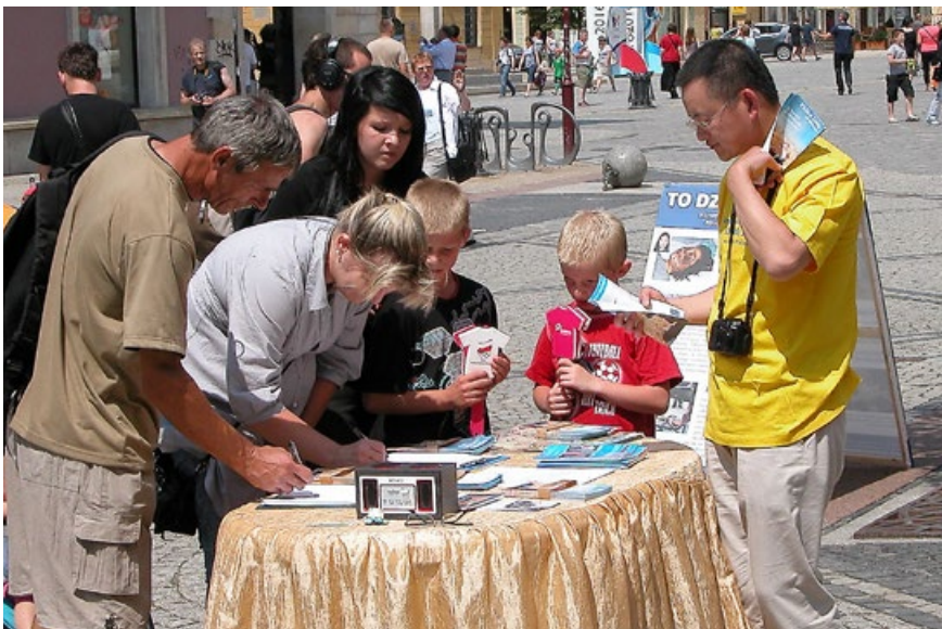
波兰弗罗茨瓦夫市的征签反迫害活动