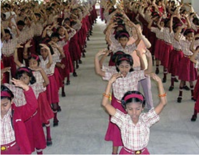
班加罗尔附近的天主教学校学生集体炼功。