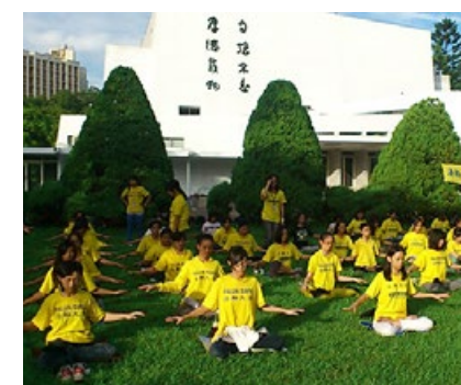
台湾各地部分青年法轮功学员会聚在台湾清华大学集体晨炼。