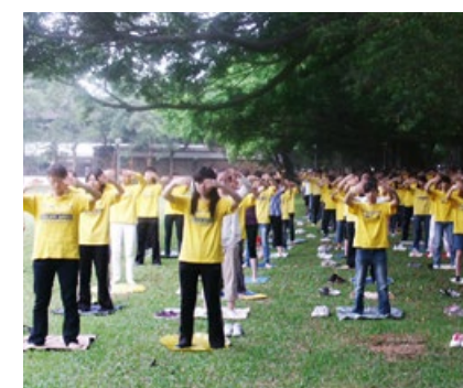
台湾部分青年法轮功学员清晨在文理大道旁炼功。