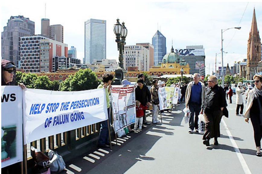
墨尔本市中心著名景点“揭露中共活摘器官暴行”的横幅和展板