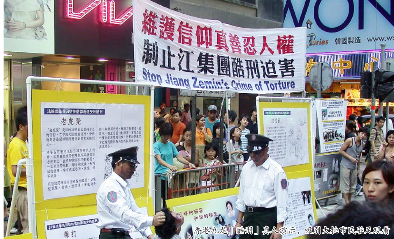
香港九龍「酷刑」真人演示，吸引大批市民駐足觀看