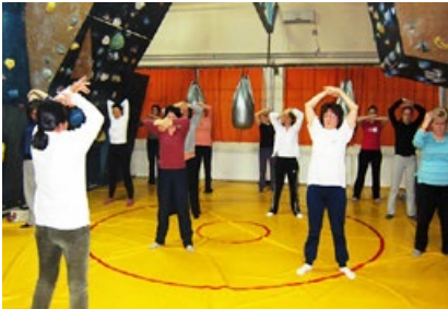
欧洲一所学校教师在炼法轮功。