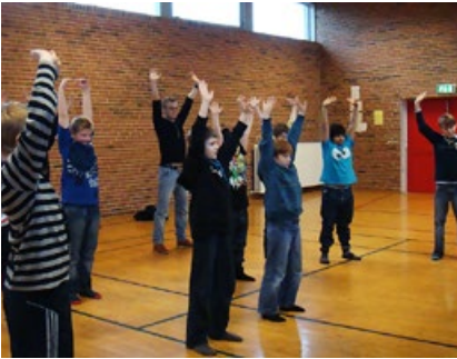
丹麦海宁市学校的学生在专注修炼法轮功。