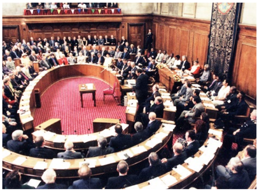
2012年7月11日，英国利兹市长、近百名市议员以及几十位市政府高级官员，一致举手通过呼吁制止中共对法轮功团体的迫害的提议。

纽约州众议员艾里克·史蒂文森与法轮功学员握手并合影留念。他说：“正义总是会战胜邪恶。我很遗憾迫害还在进行，针对（法轮功）这样和平的活动。我希望迫害能尽早结束。我希望那些人能理解并允许这些人过和平的生活，尊重（法轮功）这项活动。”