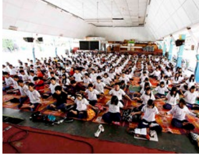
天主教高中学生在炼法轮功。

印尼苏西天主教高中的学生修炼法轮功，目的是促进和提高其学习质量，提升道德修养。校长说：“之前已经实施了许多方法，但那些似乎只是一种理论，而不是真正的改变，但从法轮大法修炼里，我们看到了实际效果。” 300 多名高中生与教师和校长都参加学炼法轮功，学生们亲身感受到修炼法轮大法的好处，一些学生感到病情消失了，睡眠也改善了。