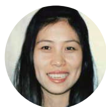
鲁迅美术学院 职工被迫害致死