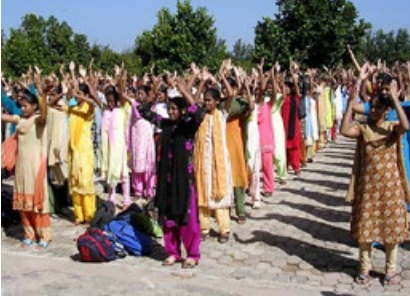
Sri Adichunchanagiri Mahasamsthama moth 学校的学生学炼法轮功。