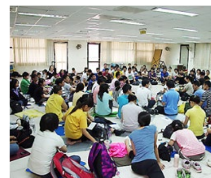
台湾部分青年法轮功学员齐聚一堂，分享各自修炼法轮功的体会。