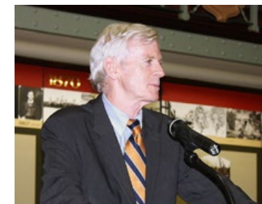
加拿大前亚太司长大卫·乔高