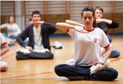
高中学生在炼法轮功。