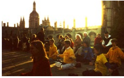
剑桥大学国王学院楼前广场上，法轮功学员炼功的身影伴着清晨那一抹冉冉升起的朝阳，给这所古老的著名学府带来勃勃生机。

举世闻名的剑桥大学是现代科学的发源地之一，有着悠久的历史气息。法轮功特有的清新纯正、优美的功法和强身健体的神奇功效，深受这所顶尖学府的欢迎，学风鼎盛的剑桥人，也有幸沐浴在法轮大法的祥和美好中。