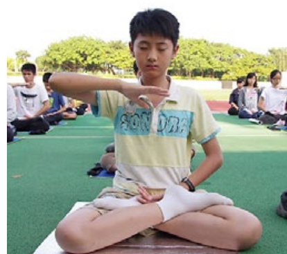
12岁的少年正在炼法轮大法第五套功法。

教人修身向善，对身心健康很有帮助。如果能从小培养孩子有“真善忍”的心境，那是孩子未来的福气；学生说，炼了法轮功之后，读书专心，不会分心，按“真善忍”要求自己，脾气变好了。也有学生说，炼功后突然变聪明了，数学成绩也大有进步。