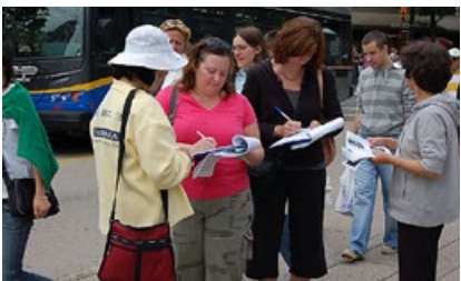
加拿大温哥华反迫害征签