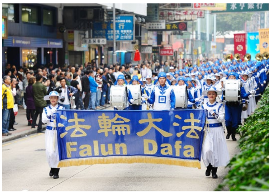
香港法轮功学员的反迫害游行队伍，天国乐团走在最前面。

团、各种方阵、表演等，成为世界各国重大庆典活动中一道不可缺少的靓丽风景。受邀参加各国重大庆典活动的当地法轮功学员把中华文化的精粹撒向世界，让中华传统文化在世界各地被接纳、称赞，也让海外华人感到由衷的自豪。