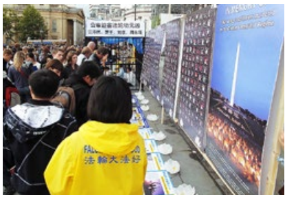
伦敦民众被法轮功真相所吸引

2013 年 4 月 20 日，美国加州圣巴巴拉市，民众在展位前了解法轮功真相，一位来自中国的医生表示，他听说过法轮功，并说他对这场迫害法轮功的暴行完全不认可。不过他一直想知道，为什么法轮功学员揭露整个中国共产党，而不只是限于某几个邪恶的施暴者。当学员向他讲述大卫·乔高和大卫·麦塔斯关于中共活体摘取法轮功学员器官的独立调查报告时，他意识到，中共这个组织是这场迫害的背后元凶。