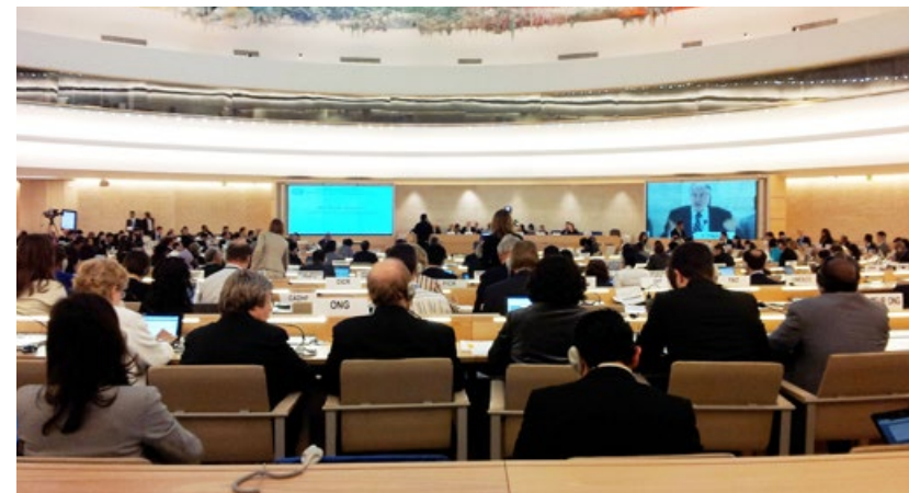
联合国第27届人权大会现场

美国国会、加拿大国会与欧洲议会都进行了关于中共活摘器官罪行的听证会。《华盛顿时报》、《法新社》、德国《时代周刊》等多家国际媒体都做了相关报道，国际社会强烈谴责中共这一惊天罪行。