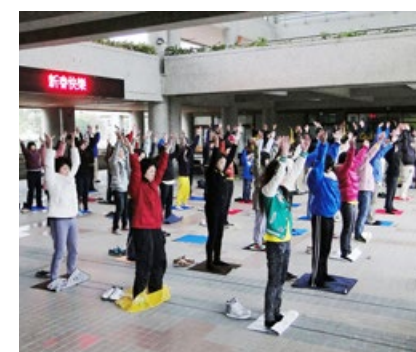
台湾国立云林科技大学大厅里，部分法轮功青年学子在晨炼。