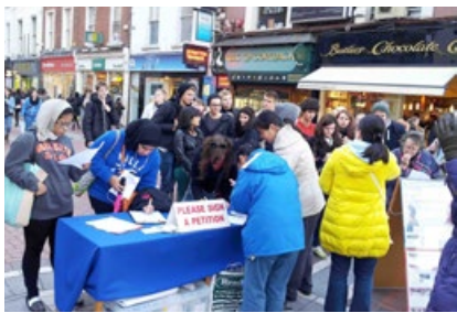
爱尔兰反迫害征签