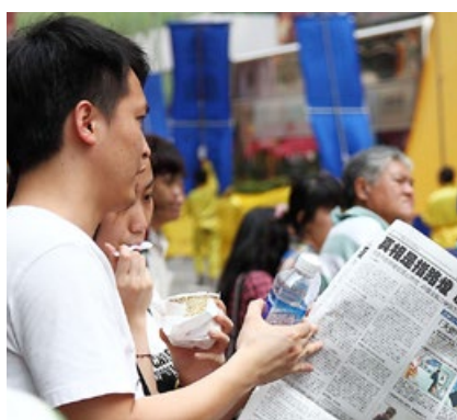
大陆游客一边看法轮功游行，一边阅读真相特刊。