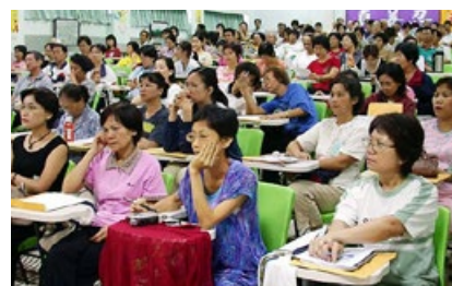
为期5天的法轮大法研习营，屏东县内140多位教师们专心听讲并习炼。