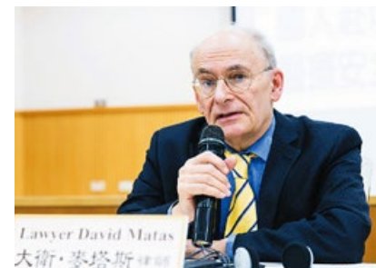
人权律师大卫·麦塔斯