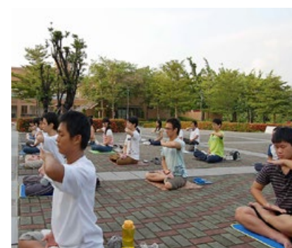
台湾各地的青少年法轮功修炼者在高雄第一科技大学晨炼。