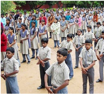
Byreshawara 学校高中生集体炼功。