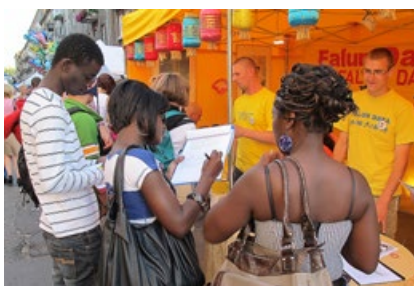
刚果游客在波兰华沙反迫害征签