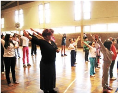
小学八个年级的师生集体炼法轮功第一套功法。