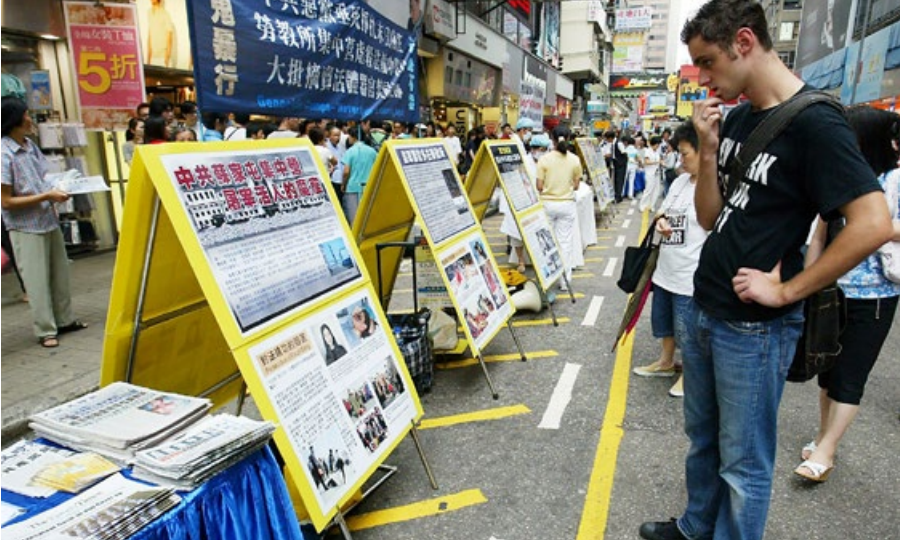
民众观看有关中共活体摘取法轮功学员器官的展板。