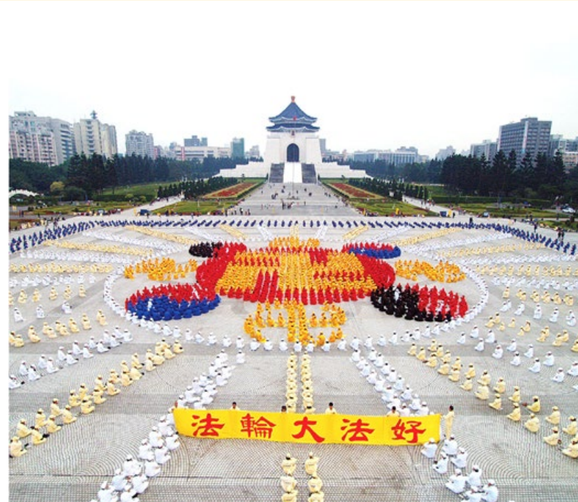
▲ 法輪功學員在臺北自由廣場集體煉功並排出法輪圖形