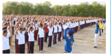
印度 80 多所學校師生學習法輪功