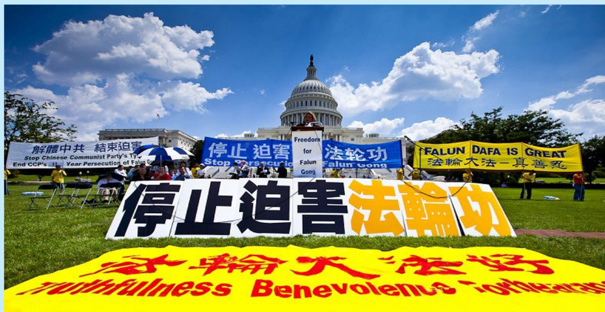
▲ 美國華盛頓民眾在國會山莊前集會，要求中共停止迫害法輪功，嚴懲兇手，各界政要到場支持並發表演講。

世界各大媒體如“法新社”、美國“商業週刊”、“德國之聲”、新加坡“海峽時報”、香港“南華早報”皆迅速作出回應，紛紛報導或轉載這一消息。