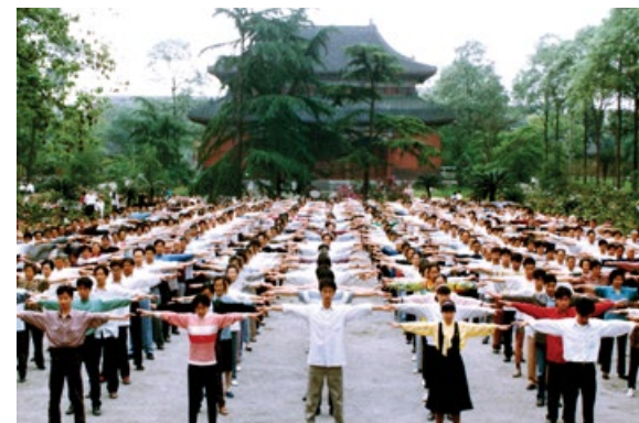
▼ 成都法輪功學員集體晨煉的場景。

1999年7月，江澤民出於個人妒忌，與中共相互利用，以莫須有的罪名，發動了對法輪功的殘酷迫害，用盡各種構陷抹黑的手段，只為挑起全國人民的仇恨，為迫害找藉口。但紙