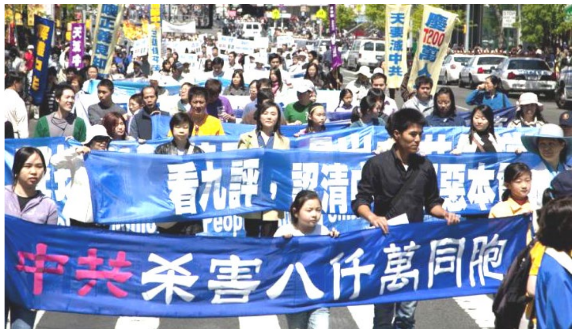
▲ 2009年4月26日，香港舉行制止中共迫害法輪功大遊行。

法輪功學員今天所做的這一切就是為了說出真相，揭穿謊言，制止這場邪惡的迫害。而絕不是“搞政治”，而是在維護中國人的正當權益。