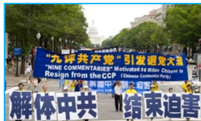
▲ 2011年7月15日，聲援“三退”（退黨、退團、退隊）的遊行隊伍在美國華盛頓DC的大道上前進。

自己的收入製作真相資料；他們不求任何回報，所有的付出與努力只是為了讓被中共謊言蒙蔽的人們明白真相，因為這關係到每一個生命的選擇與未來。