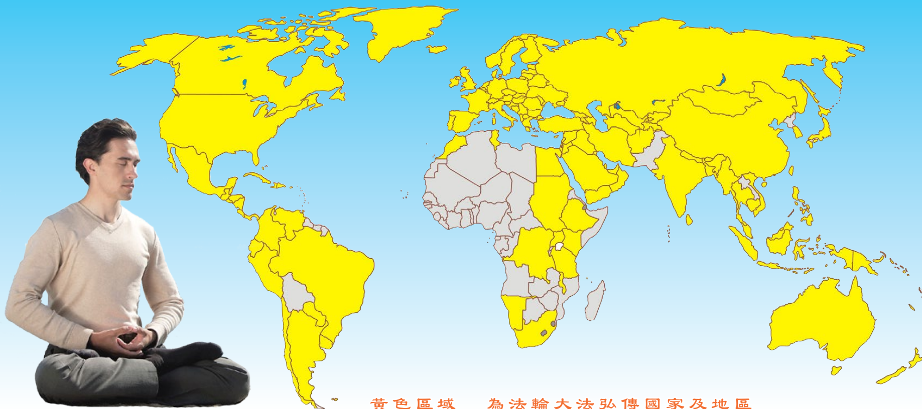
黃色區域 為法輪大法弘傳國家及地區