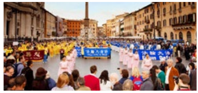
加拿大法輪功學員參加感恩節遊行