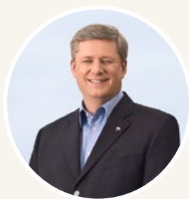
加拿大總理祝賀法輪 大法弘傳 21 週年

2013 年 5 月，加拿大總理哈珀與部長等政要給法輪大法學會發出賀信，稱讚法輪功對社會作出的貢獻，這是哈珀總理連續第八年發出賀信。哈珀總理在賀信中說：“我很高興地向所有慶祝法輪大法傳世 21 週年的人們致以最熱烈的問候。在過去的 20 多年間，全世界有無數的人受益於修煉法輪大法。法輪功的核心理念真、善、忍在我們的多元文化社會中引起了強烈的共鳴。”