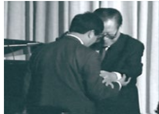
▲ 2002年10月，江澤民以私人名義訪問美國期間於芝加哥當地宴會上，接到起訴狀，驚慌失措。