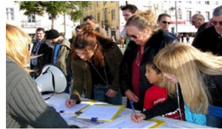
▲ 葡萄牙·里斯本·若斯奧廣場

海內外上億的修煉者共同堅守對“真善忍”的正信，持之以恆地向社會各界講清真相。法輪功學員和平理性的抗爭向世界展示了信仰的力量，覺醒的世人紛紛伸出援手，給予正義的支持與關注。下圖為各國民眾簽名反迫害現場。