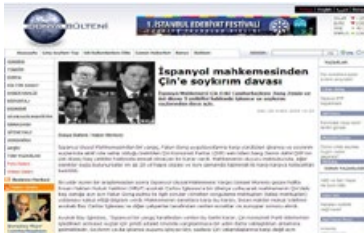
▲ 土耳其《世界導報》等世界各大媒體報導江澤民、羅幹、薄熙來等中共高官因迫害法輪功被起訴。

14年來，江氏集團殘酷迫害法輪功修煉人的行為，已經構成聯合國1998年所頒佈的《國際刑事法院羅馬規約》第6條“滅絕種族罪”和第7條的“危害人類罪”。凡是觸犯此類人權侵害罪行的獨裁者，可以在任何國家的法庭對其提起訴訟。從2001年至今，在全球六大洲40多個國家，因迫害法輪功被起訴的中共高官達40餘名，包括中共前頭目江澤民以及嚴重參與迫害法輪功的羅幹、周永康、薄熙來等。其中薄熙來、劉淇、夏德仁等已被判處有罪。