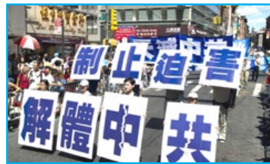
▲ 2010年9月4日，來自世界各地的法輪功學員在美國曼哈頓，舉行了主題為“呼喚良知，停止迫害”的遊行。

時至今日，越來越多的人明白了真相，也有越來越多的正義之士及國家紛紛譴責中共迫害法輪功的罪行。希望您能靜下心來仔細思考這一切，早日洞悉謊言，明白真相，遠離邪惡，擁有一個美好的未來。