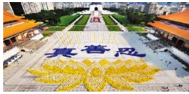
臺灣法輪功學員集體煉功排字