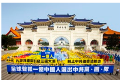
▲ 臺北大遊行，慶祝一億中國民眾退出中共黨、團、隊。