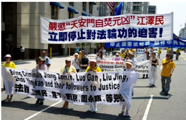
◀ 3000多名法輪功學員在美國首都華盛頓DC遊行，呼籲終止中共對法輪功的殘酷迫害。