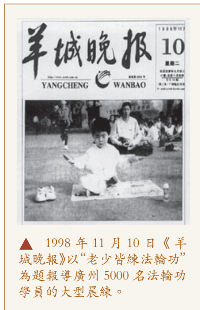
▲ 1998年11月10日《羊城晚報》以“老少皆練法輪功”為題報導廣州5000名法輪功學員的大型晨練。

基於對敬天信神的敵視，共產黨製造了一連串打壓信仰的歷史。在中國古代，上至國君、下至臣民對天地神佛都心懷敬畏，唯獨中共的獨裁統治，讓中國傳統儒、釋、道三教名存實亡。有人認為現在中國人是有宗教自由的，但這只是一個假相，因為中共的信仰自由都是經過刻意挑選、經過嚴密的操作的，只局限於能嚴密控制的教會或寺廟。共產黨強制推行“無神論”，對善惡標準進行隨意解釋，根本沒有真正的“是非善惡”標準可言。而對法輪功修煉者來說，事情對錯是用“真善忍”來衡量的，而這顯然也成了中共控制人民“統