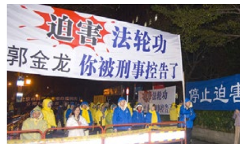
▲ 2012年2月18日晚，法輪功學員在台大體育館入口處守候北京市長郭金龍一行人，抗議郭金龍等人迫害法輪功。

人群治罪”條例，包括（前）河南省委書記徐光春、廣東省長黃華華、陝西代理省長趙正永、中共國家宗教局長王作安、湖北省“六一零辦公室”頭目楊松、北京副市長吉林、遼寧省長陳政高、安徽省長王三運，以及2012年2月16日訪台當天即被控告的北京市長郭金龍等九人。