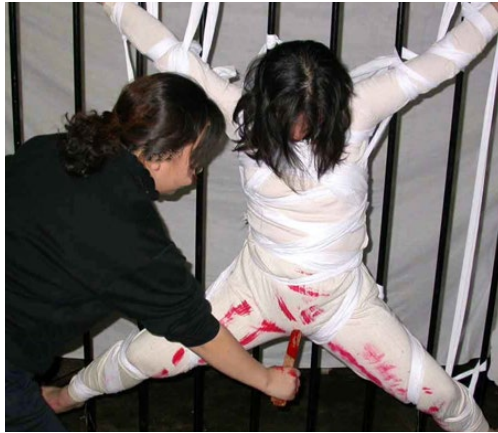
▲ 中共抓住女性生理的弱點，用最殘暴的方式迫害女法輪功學員。上圖為親身經歷迫害的法輪功學員模擬所受酷刑。

1999年7月，中共與江氏集團針對上億名信仰真善忍的法輪功學員開始了殘酷迫害。江澤民在迫害法輪功的運動中，奉行的原則是“名譽上搞臭，經濟上截斷，肉體上消滅”。在其指令和授意下，專事迫害法輪功的“610”組織執行“打死白打死”，“打死算自殺”、“不查身源、直接火化”的滅絕政策。其結果是，中國各地酷刑氾濫，虐死不負刑責，花招百出。