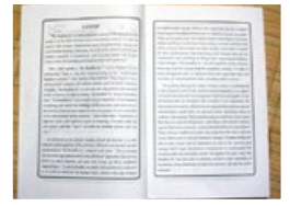
印度的學校把《轉法輪》中《論語》（英文版）列為學生教材