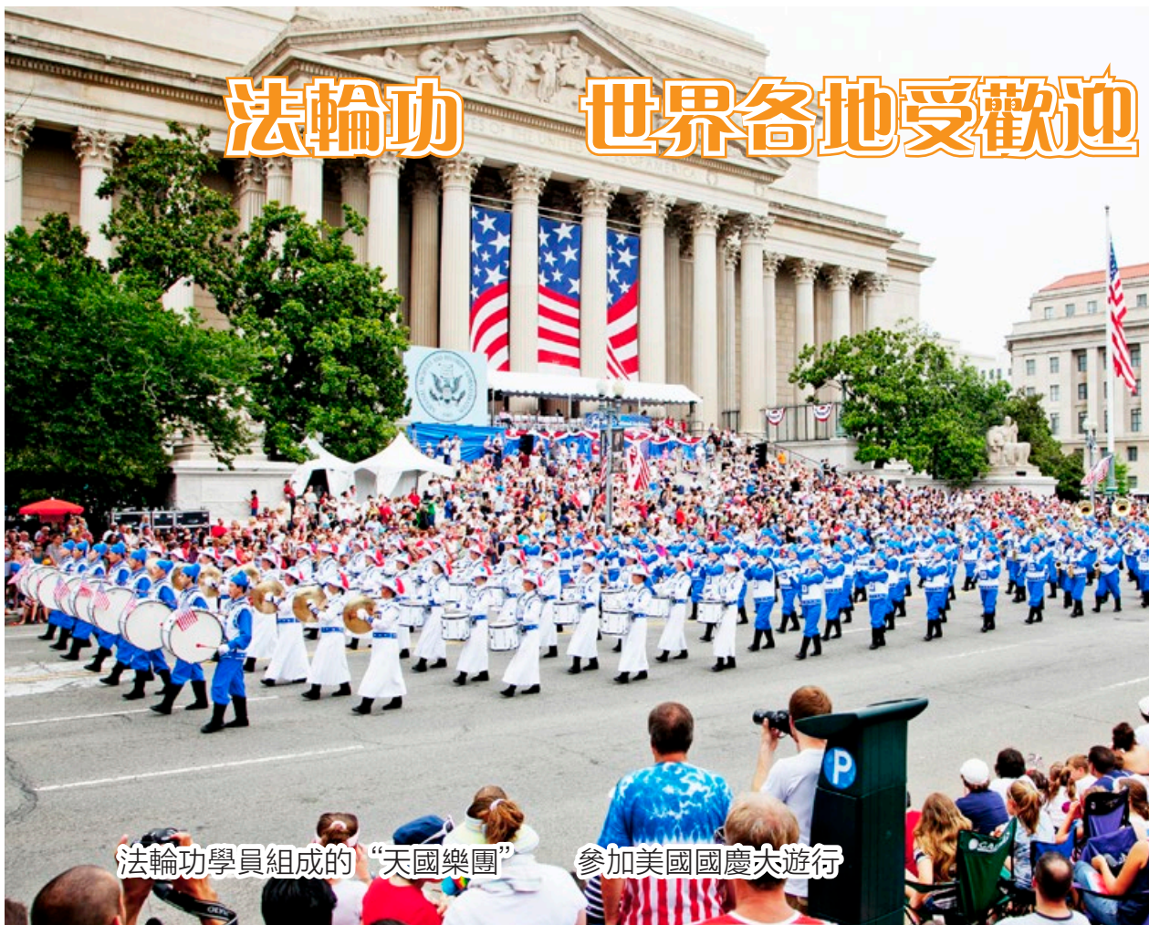
法輪功學員組成的“天國樂團”參加美國國慶大遊行