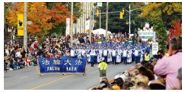
歐洲法輪功學員羅馬集會遊行