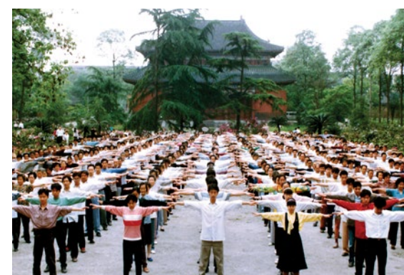
▼ 成都法轮功学员集体晨炼的场景。

包不住火，谎言终究会曝光，到了自由民主国家和地区的人们，经常惊讶地看到与中共宣传完全不一样的事实。谣言止于智者，您是否愿意敞开心扉来了解真相呢？