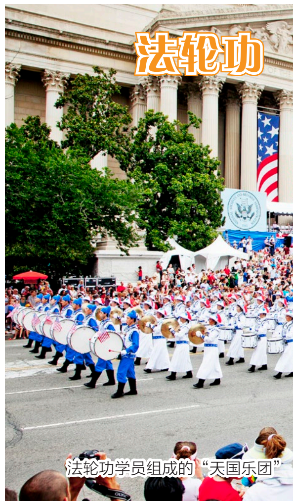
法轮功学员组成的“天国乐团”