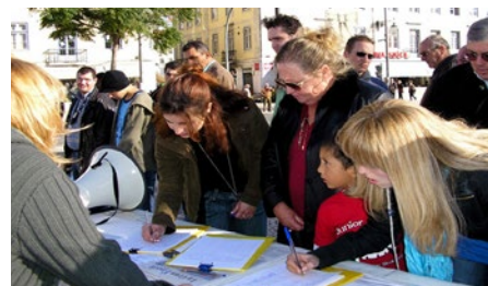
▲ 葡萄牙·里斯本·若斯奥广场

海内外上亿的修炼者共同坚守对“真善忍”的正信，持之以恒地向社会各界讲清真相。法轮功学员和平理性的抗争向世界展示了信仰的力量，觉醒的世人纷纷伸出援手，给予正义的支持与关注。下图为各国民众签名反迫害现场。