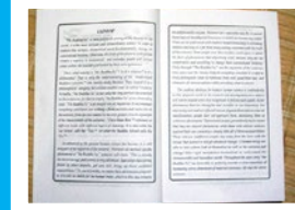
印度的学校把《转法轮》中《论语》（英文版）列为学生教材