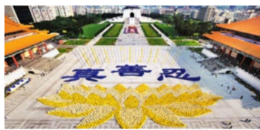
台湾法轮功学员集体炼功排字