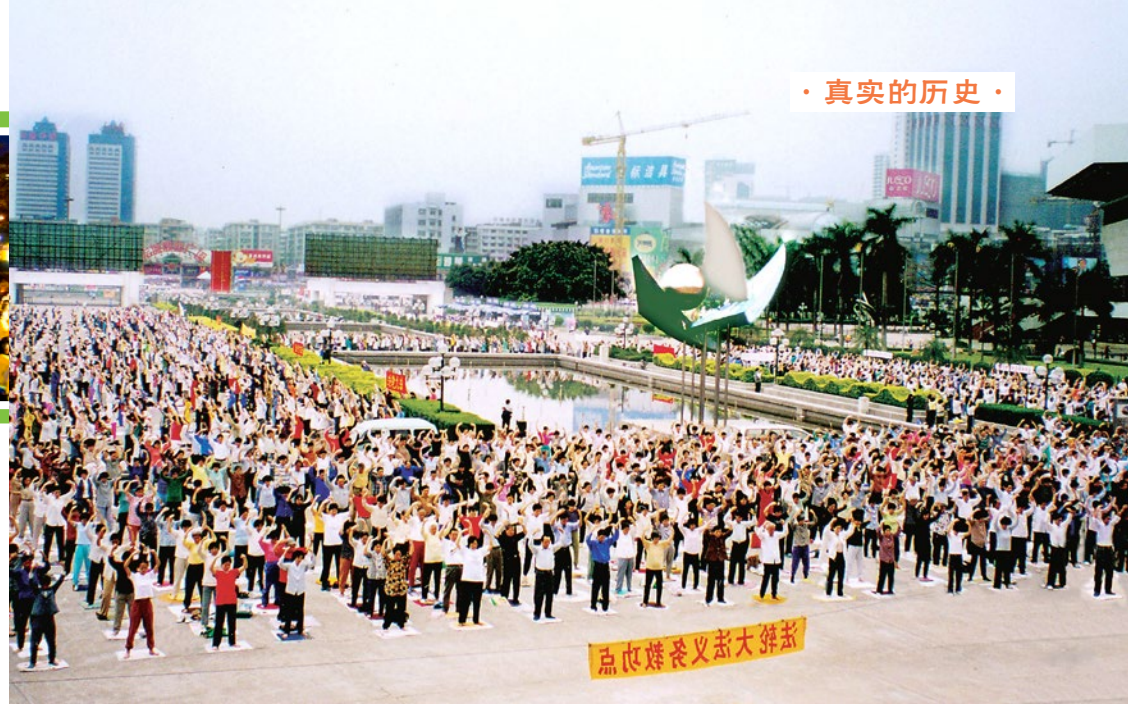
▲ 中共发动迫害之前，法轮功学员在大陆集体炼功的场面随处可见。上图为1998年，广州的一个法轮功炼功点的学员们在晨炼。

提高、身体的健康。因此在短短的7年里，大陆修炼法轮功的人数就多达1亿人，这让中共发自内心地恐惧与嫉妒。