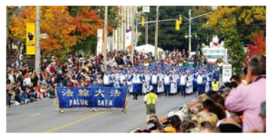
加拿大法轮功学员参加感恩节游行