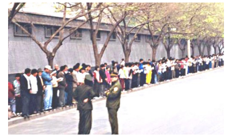
▲ 上图为“4·25”上访现场。一位亲历“4·25”的法轮功学员说，“整个现场秩序井然；穿着制服的警察很悠闲，有的与学员搭话，有的在相互聊天”。

出于对政府的信任，各地法轮功学员4月25日自发来到国务院信访局（中南海旁边）和平上访，上访群众由警察引领在中