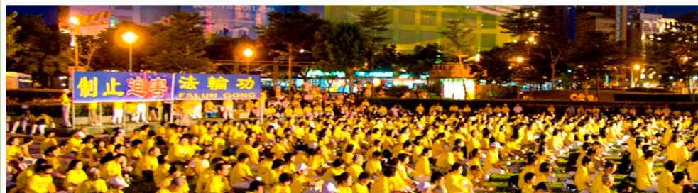
▲ 2010年7月18日，台湾北区法轮功学员于台北信义广场烛光悼念在中国