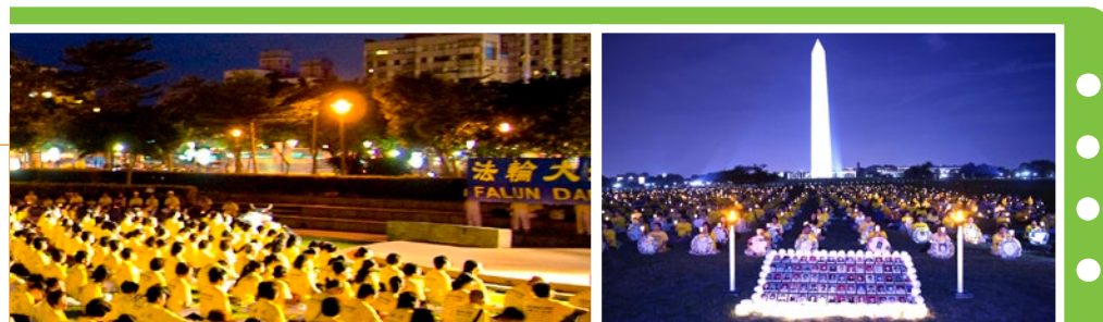
大陆被迫害致死的法轮功学员

中共的历史是一部典型的政治运动史与造假谎言史。从 1949 年至今，中共几乎每隔一段时间就要搞一次大规模的政治运动，每一次运动都会制造一批冤假错案，想镇压谁，就镇压谁。法轮功在中国大陆的弘传使民众们得到了道德的