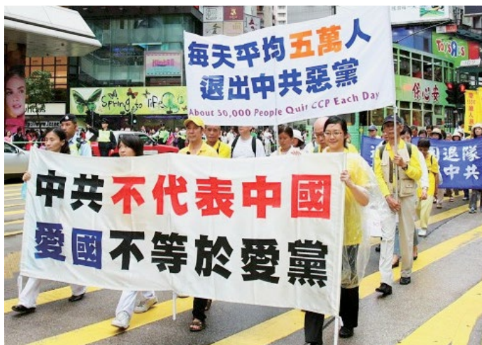
▲ 香港民众举行反迫害大游行。

自 1999 年法轮功被迫害以来，中国灾害一年重于一年，超级天灾愈见频繁，范围与程度皆属历史少见。几十年不遇的洪水、大旱、地震、泥石流、风灾、天坑、夏雪以及各种瘟疫、人祸越演越烈，连中共官方自己都极力地掩盖其中的关联性。人不治天治，正在发生的大规模天灾，正是神在警告人迫害佛法、迫害正信所犯下的罪恶。