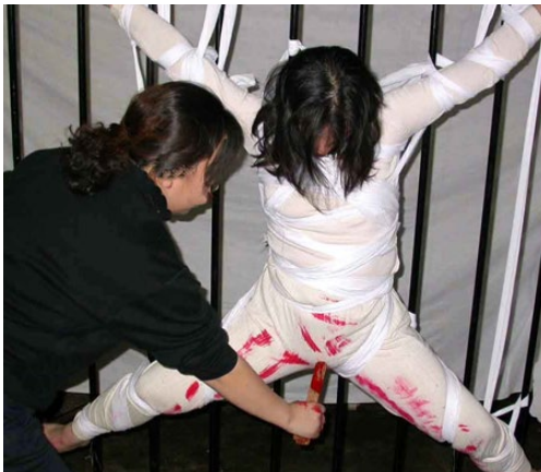
▲ 中共抓住女性生理的弱点，用最残暴的方式迫害女法轮功学员。上图为亲身经历迫害的法轮功学员模拟所受酷刑。