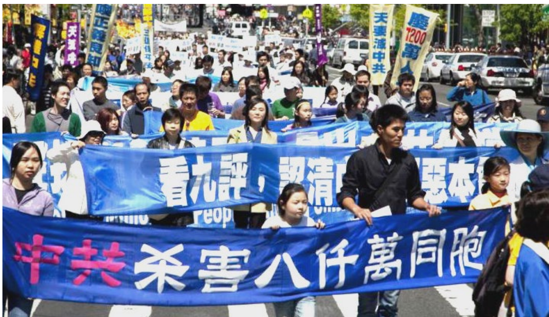
▲ 2000多名法轮功学员聚集在纽约法拉盛举行反迫害大游行。