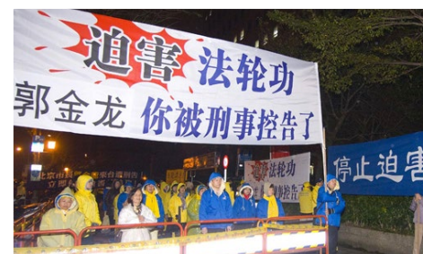
▲ 2012年2月18日晚，法轮功学员在台大体育馆入口处守候北京市长郭金龙一行人，抗议郭金龙等人迫害法轮功。