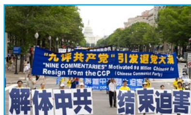
▲ 2011年7月15日，声援“三退”（退党、退团、退队）的游行队伍在美国华盛顿DC的大道上前进。

自己的收入制作真相资料；他们不求任何回报，所有的付出与努力只是为了让被中共谎言蒙蔽的人们明白真相，因为这关系到每一个生命的选择与未来。