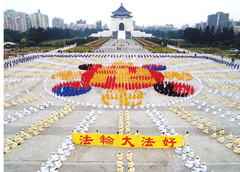
▲ 法轮功学员在台北自由广场集体炼功并排出法轮图形

请用自由门、无界浏览等翻墙软件浏览明慧网（ www.minghui.org ）了解事实真相。翻墙软件获取方法，详情请见下方。▼