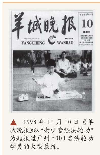
▲ 1998 年 11 月 10 日《羊城晚报》以“老少皆练法轮功”为题报道广州 5000 名法轮功学员的大型晨练。

基于对敬天信神的敌视，共产党制造了一连串打压信仰的历史。在中国古代，上至国君、下至臣民对天地神佛都心怀敬畏，唯独中共的独裁统治，让中国传统儒、释、道三教名存实亡。有人认为现在中国人是有宗教自由的，但这只是一个假相，因为中共的信仰自由都是经过刻意挑选、经过严密的操作的，只局限于能严密控制的教会或寺庙。共产党强制推行“无神论”，对善恶标准进行随意解释，根本没有真正的“是非善恶”标准可言。而对法轮功修炼者来说，事情对错是用“真善忍”来衡量的，而这显然也成了中共控制人民“统