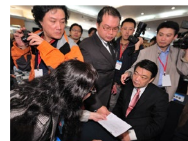
▲ 中共北京副市长吉林在数百人的会场上，对递到眼前的诉状，一脸愕然。