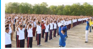
印度 80 多所学校师生学习法轮功