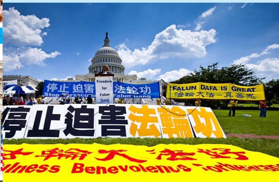
▲ 美国华盛顿民众在国会山庄前集会，要求中共停止迫害法轮功，严惩凶手，各界政要到场支持并发表演讲。