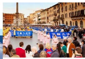
功学员罗马集会游行

害人群治罪”条例，包括（前）河南省委书记徐光春、广东省长黄华华、陕西代理省长赵正永、中共国家宗教局长王作安、湖北省“六一零办公室”头目杨松、北京副市长吉林、辽宁省长陈政高、安徽省长王三运，以及 2012 年 2 月 16 日访台当天即被控告的北京市长郭金龙等九人。