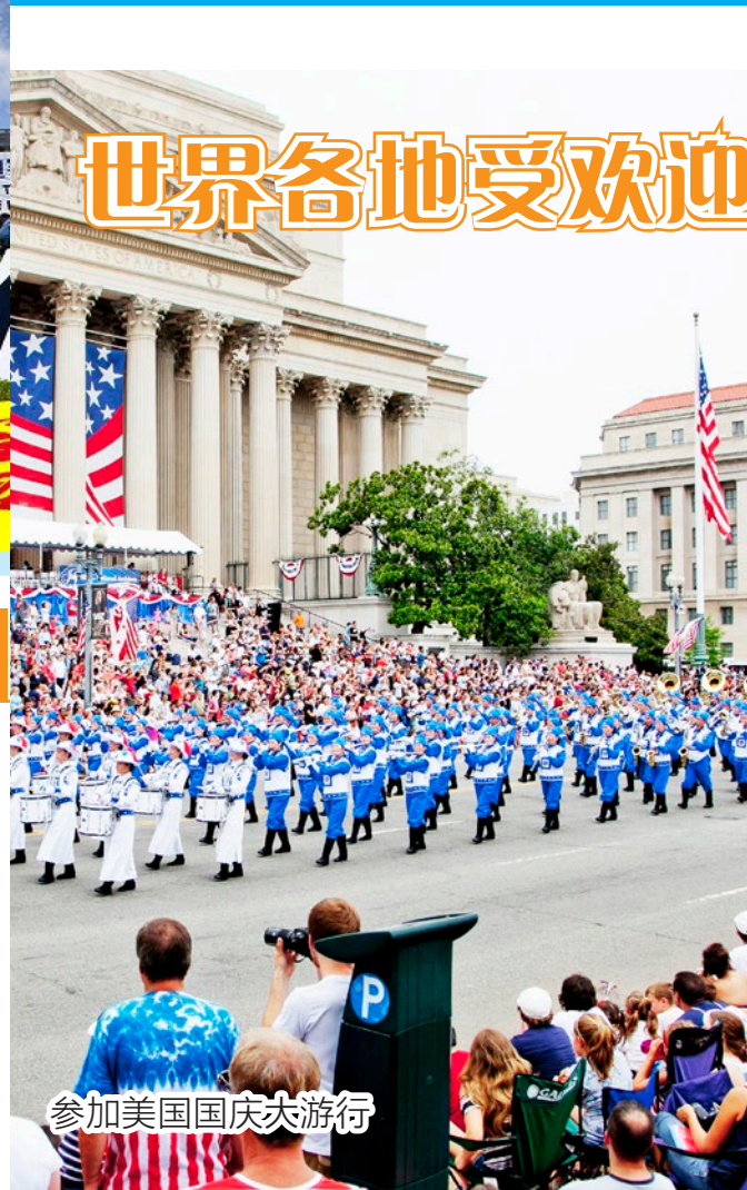
参加美国国庆大游行