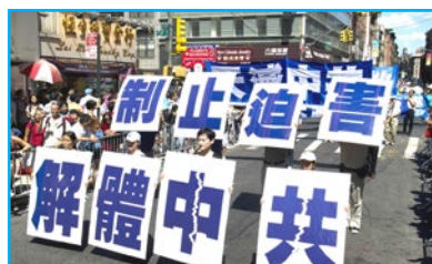
▲ 2010年9月4日，来自世界各地的法轮功学员在美国曼哈顿，举行了主题为“呼唤良知，停止迫害”的游行。

时至今日，越来越多的人明白了真相，也有越来越多的正义之士及国家纷纷谴责中共迫害法轮功的罪行。希望您能静下心来仔细思考这一切，早日洞悉谎言，明白真相，远离邪恶，拥有一个美好的未来。