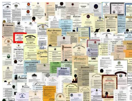
图：世界各国对法轮大法的部分褒奖