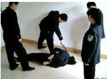
酷刑演示：电棍电击