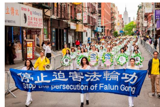
▲悼念被迫害致死的大陆法轮功学员

“这些来自不同国度的人，有不同的社会背景，有老有少，却为着一个共同信念汇集一起，我感到惊讶、震撼。在这物质化的时代，奋斗、谋求利益已成很多人生活的一部分，这世界变得越来越灰暗、悲凉。而这些人，虽然我还不甚了解，但可以看出，他们不是为了自己，从传单上，我理解他们是为‘真、善、忍’理想而付出，这对所有人都非常重要。”她记下法轮大法的网址，希望能深入了解。