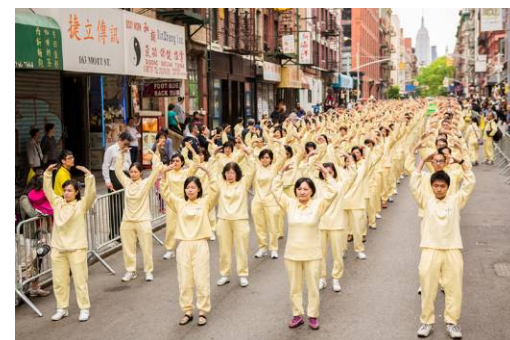
▲游行中法轮功学员演示功法动作