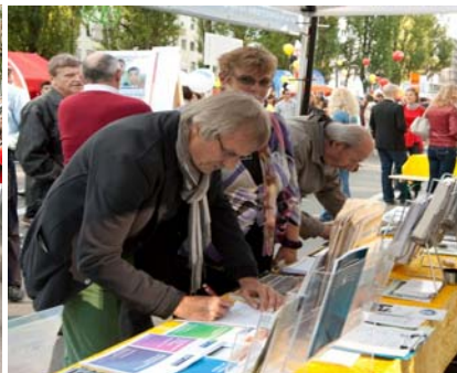
图 1: “中共当局进行活摘器官”的横幅引起人们的关注