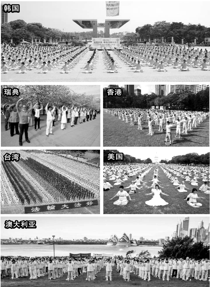
世界各地法轮功学员集体炼功精选