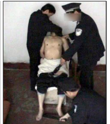
酷刑演示: 倒拖、高压电棍电击

从铁椅子上卸下来, 换手铐后, 押他上了一辆面包警车, 准备将于溟关入沈阳市看守所。