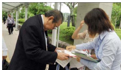
在移植大会入口处征集反迫害签名

许多参加会议的各国医师都很关注这个事，纷纷向麦塔斯咨询自己的疑问。一位日本大媒体的记者专程坐新干线一个多小时，从东京来到京都的会议现场，对麦塔斯进行了近两个小时的采访，并表达了自己的敬