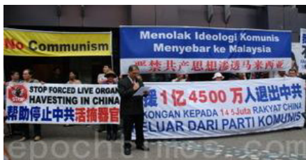
图：2013年9月8日，马来西亚退党服务中心声援1亿4500万中国人“三退”。

全世界的“三退”大潮正在全面解体着邪恶的中共，朋友啊，你看清了这一切了吗？你顺应天意“三退”了吗？◇