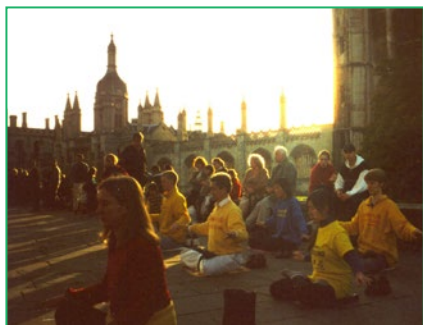
▲ 剑桥大学法轮功学员在炼功

举世闻名的剑桥大学是现代科学的发源地之一，有着历史悠久的文化气息。法轮功特有的清新纯正、优美的功法和强身健体的神奇功效，深受这所顶尖学府的欢迎。学风鼎盛的剑桥人，也有幸沐浴在法轮大法的祥和美好中。