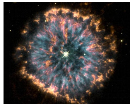
▲ 上图为哈勃太空望远镜拍摄到的遥远星云照片，这张照片被称为“天体之眼”。

无独有偶，英国剑桥大学天文研究所的专家发现，他们的软件可以应用于病理学上的细胞组织切片的染色分析。为了研究癌症等难题，医学人员准备了成千上万的细胞组织切片染色，但是它们明暗不一，形状各异，大小不同，再加上各种背景染色的干扰，这么多数据分析起来很令人发愁。幸运的是，剑桥