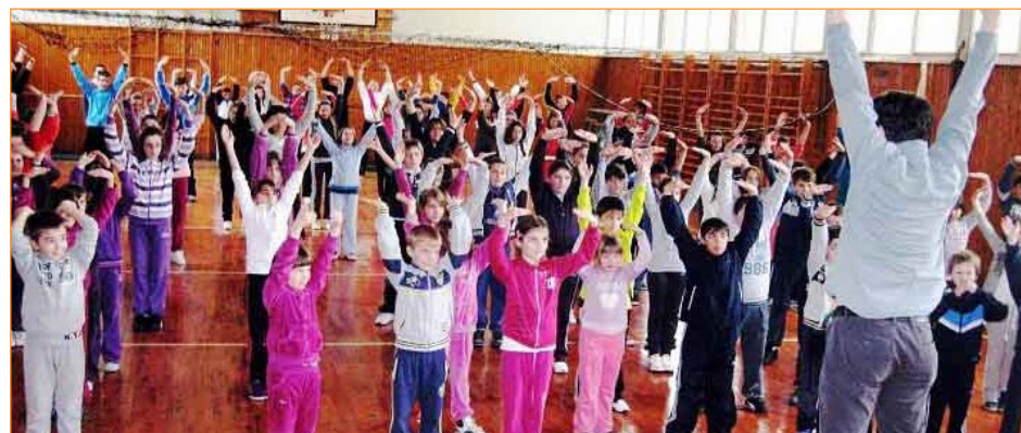
▲ 图为欧洲多所学校的师生在学炼法轮功。