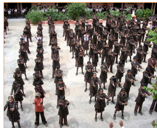
▲ 仅在印度的班加罗尔这一座城市，就有80多个学校的师生炼法轮功。