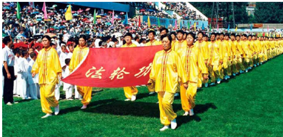
▲ 1998年8月20日，法轮功学员在沈阳亚洲体育节开幕式上入场。《中国青年报》刊载《生命的节日》对参加该体育节的法轮功学员做了报道。

1992年至1999年七年间，法轮功以人传人、心传心的方式迅速传遍神州大地。据1998年底中国政府的一项统计显示，全国学炼法轮功者超过七千万。修炼者身心净化，道德回升。1998年，部分人大离退休老干部对法轮功进行了数月的详细调查研究，得出“法轮功于国于民有百利而无一害”的结论。