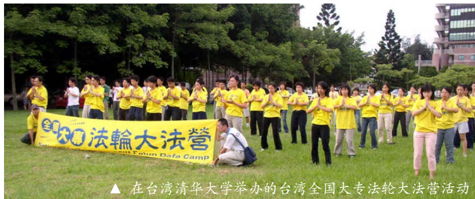
▲ 在台湾清华大学举办的台湾全国大专法轮大法营活动