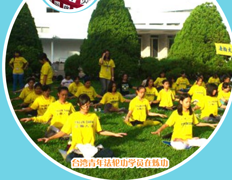
台湾青年法轮功学员在炼功