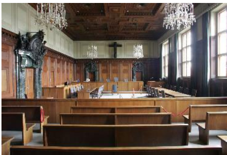
▲ 上图是纽伦堡国际法庭纪念馆

他还说：“我想做的事，不过是要以我微弱的能力来为真理和正义服务，准备为此甘冒不为任何人欢迎的危险。”