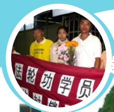
北京清华大学法轮功学员 被迫流亡海外