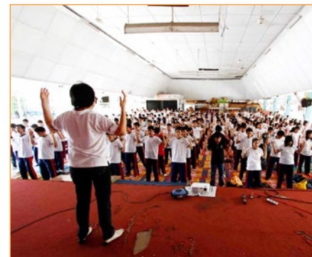
▲ 左图为西班牙萨拉戈萨市公立学校中学师生们一起学炼法轮功，右图为印尼苏西天主教高中学校学生在学炼法轮功。