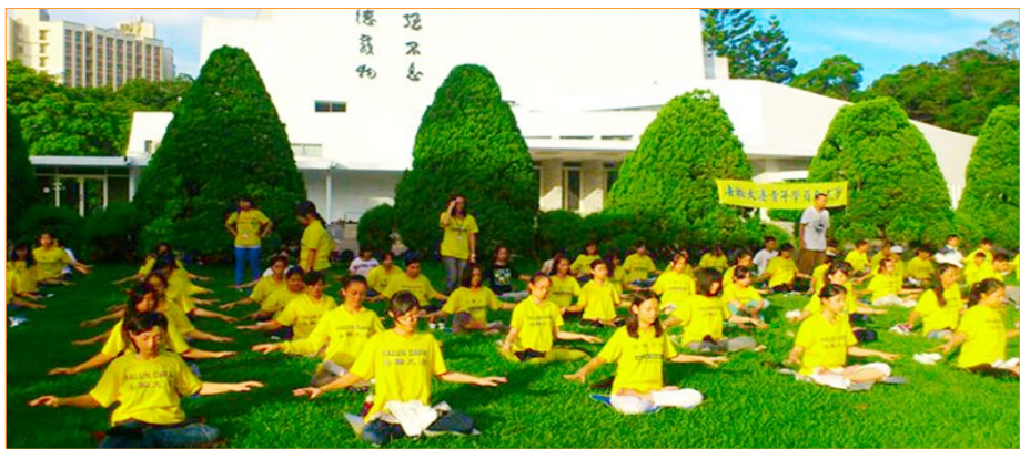
▲在台湾，法轮功修炼者达几十万人。图为部分台湾青年学子在集体炼功。

台湾清华大学于 1956 年在新竹复校，培育无数人才，在国际上也享有盛名。如今，在台湾清华大学的校园，有一道独特的风景：每到中午，在美景如画的成功湖畔，都会看到清华大学的法轮功修炼者宁静祥和的炼功场景；每逢清华的重要庆典，都可看到摆设整齐的法轮功真相展板。