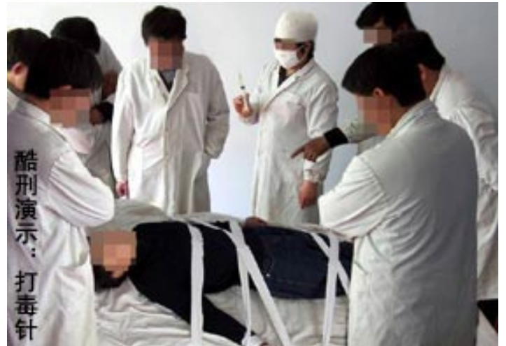
图：酷刑演示：打毒针（注射不明药物）。

从劳教所回家后，学校得知她还坚持修炼时，不准她上班，不发一分钱工资。她去校保卫处讲真相，要求