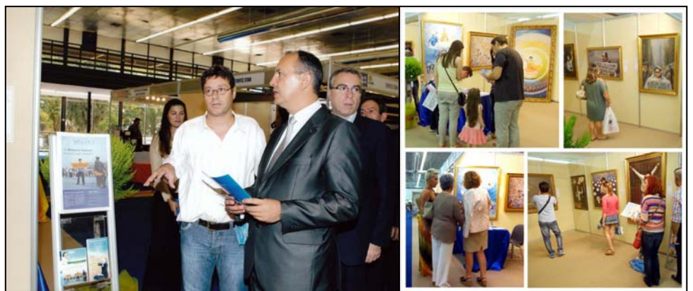
左：希腊北部部长在听法轮功学员讲解；右：观看画展的人们络绎不绝

画展期间，希腊北部部长 Karaoglou Theodoros 先生，议员 Varvitsiotis 先生和议员 Sakorafa 女士，还有欧洲议会议员 Skylakakis 先生等政要都前来参观画展。他们站在“医生活摘法轮功学员器官”那幅油画前，一边凝神看，一遍认真听法轮功学员讲这幅画的背景。当他们听说画面上活摘器官的血腥场面都是根据实际情况画出来的，这样活摘法轮功学员器官的案件在中国大量真实发生过，并且现在还继续发生时，