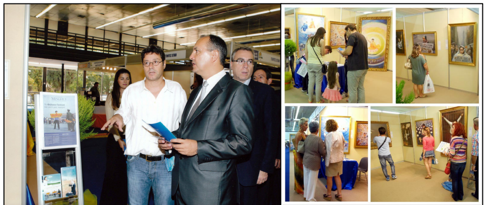
左：希腊北部部长在听法轮功学员讲解；右：观看画展的人们络绎不绝

画展期间，希腊北部部长 Karaoglou Theodoros 先生，议员 Varvitsiotis 先生和议员 Sakorafa 女士，还有欧洲议会议员 Skylakakis 先生等政要都前来参观画展。他们站在“医生活摘法轮功学员器官”那幅油画前，一边凝神看，一遍认真听法轮功学员讲这幅画的背景。当他们听说画面上活摘器官的血腥场面都是根据实际情况画出来的，这样活摘法轮功学员器官的案件在中国大量真实发生过，并且现在还继续发生时，